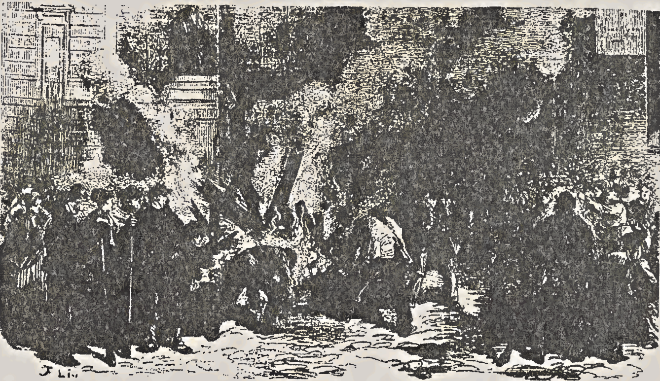
Distruzione della ghigliottina il 6 aprile 1871 nella Piazza della Mairie

La Repubblica è incapace di difendere Parigi e di resistere ai prussiani. Alla volontà di emancipazione sociale del popolo, lo Stato risponde con il tradimento e la repressione. La provocazione di Thiers provoca l'insurrezione e la proclamazione della Comune: ecco quali furono le sue realizzazioni.