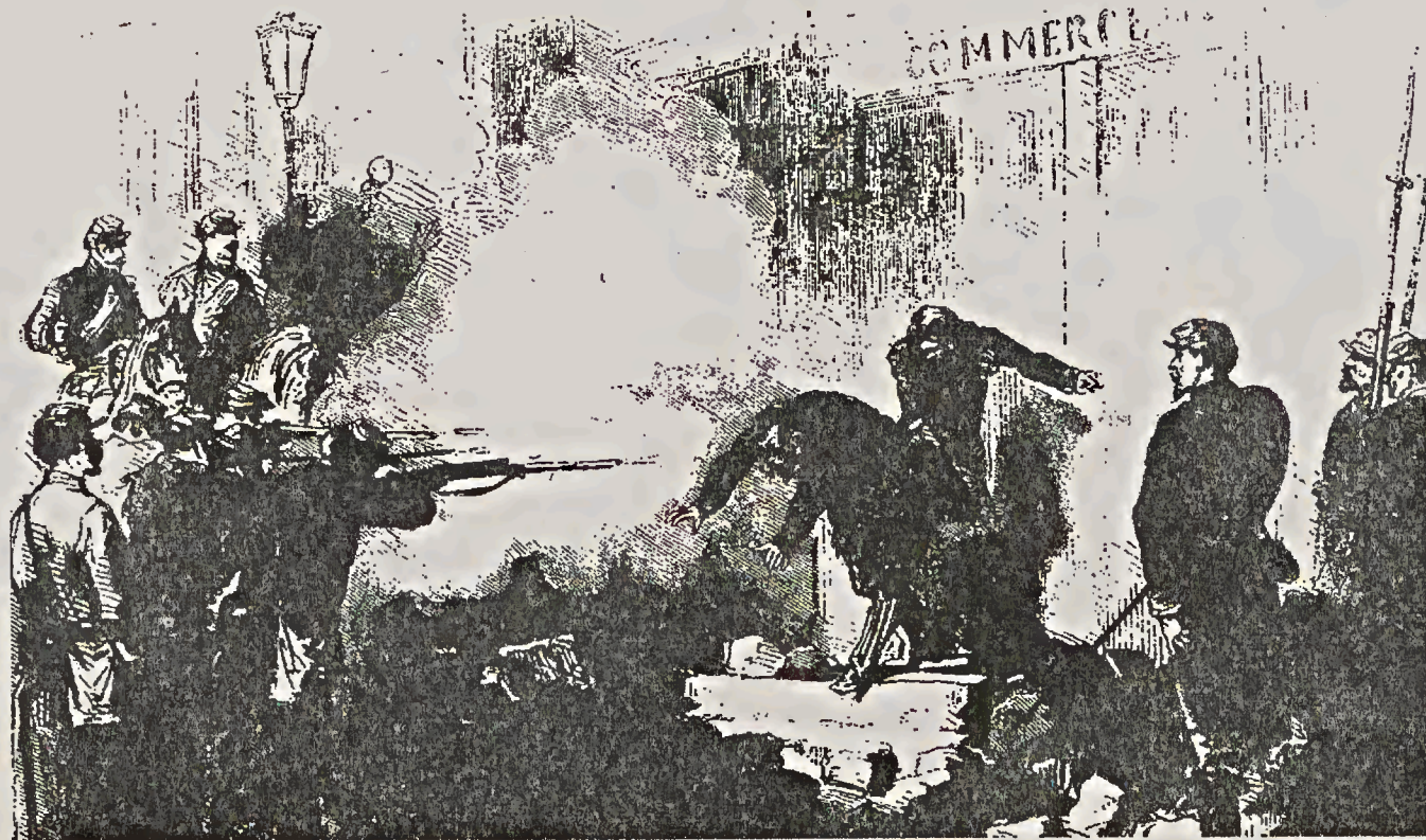
Esecuzione sommaria, il 25 maggio alle 6,30 del pomeriggio, di comunardi presi, armi in mano, nella via principale Rue Saint Germain l'Auxerrois

(liberamente tradotto da "Tutto ciò non impedisce, Nicolas..." di Sebastien Besson, "Itineraire", n.11, 1993)