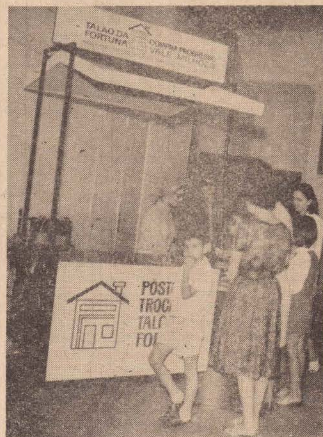
Um aspecto do posto de troca do talão da fortuna, no térreo da Delegacia Regional da Fazenda. O afluxo do povo continua, trocando suas notas fiscais pelo talão.

Nossa reportagem esteve no posto de troca do talão da fortuna, no térreo da Delegacia Regional da Fazenda onde constatou que os prudentinos estão participando da troca de lalões - 95% - pois no mês último, bateu o record de trocas, desde que foi instituído o Talão, pois foi verificado que cada dois habitantes tem um talão, o que significa que a cidade vem colaborando totalmente no combate à sonegação fiscal,