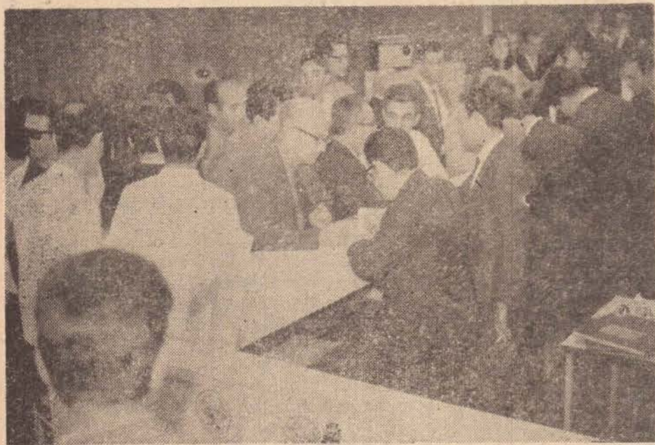
Centenas de depósitos foram feitos logo no primeiro dia de funcionamento do Banco Auxiliar. Não é de nosso conhecimento, mas os depósitos feitos somente no dia da inauguração ascendem a algumas dezenas de milhões de cruzeiros velhos. O flagrante mostra os primeiros clientes abrindo suas contas naquele estabelecimento.