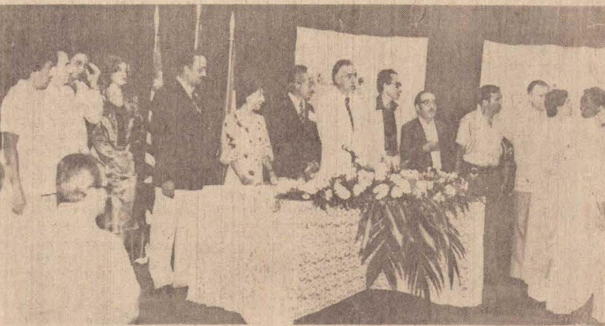
A mesa que presidiu os trabalhos de instalação do congresso do SOS ontem à noite no Teatro Municipal