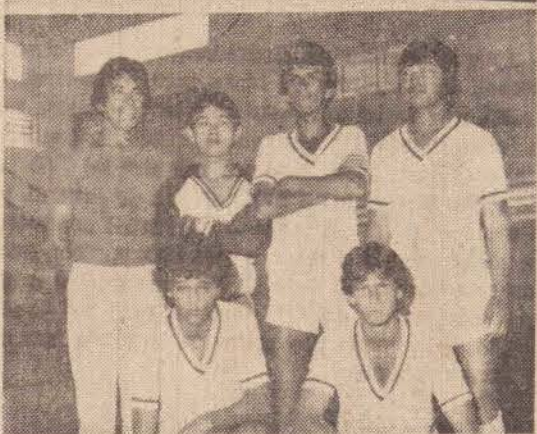
Imperial B, 3.º lugar

Destaque-se ainda que, em todo campeonato nenhum jogador completou 3 cartões amarelos. Portanto, o nivel disciplinar foi dos melhores.