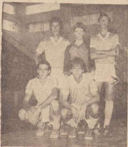
Grafica Prudentina, 2.º lugar