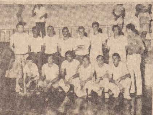
Os juizes e apontadores do campeonato