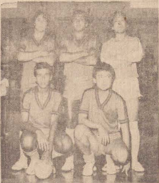
Imperial A, 1.º lugar

O melhor ataque pertenceu ao Fotocolor Imperial A, que marcou 79 gols, e sofreu apenas 25; a Grafica Prudentina, vem logo a seguir ostentando