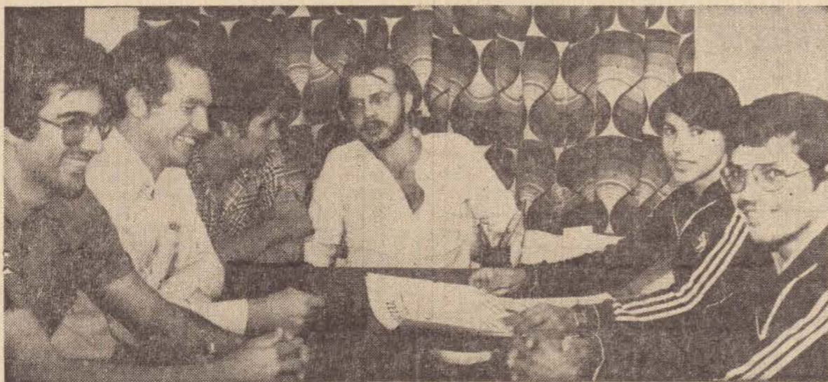
Membros da chapa "Fundação", visitaram as instalações deste jornal.

Apesar de já contar com oito anos de existência, a Faculdade Municipal Superior de Educação Física, de Presidente Prudente, não tem ainda seu diretório acadêmico. Mas agora, os alunos do 1.º e 2.º termo estão constituindo duas ou três chapas para eleger o Diretório Acadêmico "21 de junho". Os estatutos da entidade já foram aprovados em duas assembléias gerais.