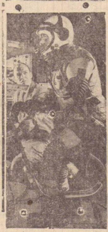
Vestimenta ultra-moderna e resistente para motociclistas de Presidente Prudente, que tem que enfrentar o trânsito local.