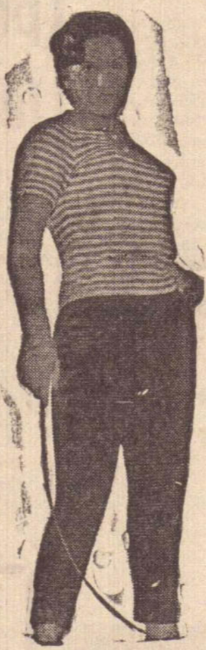
O Carnaval em Presidente Prudente iniciou assim: Calça comprida, camisa esporte e chicote para a defesa dos barba-azuis.