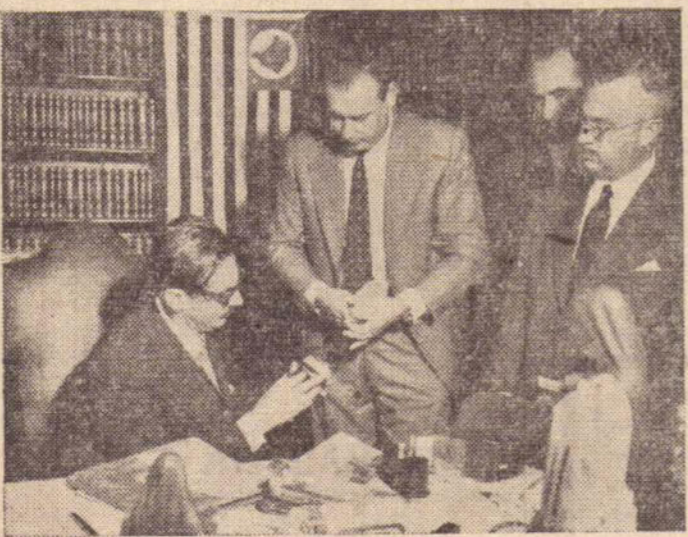
Por que eu no Legislativo Paulista, defenderei os interesses do povo da alta sorocabana, tal e qual no municipal.