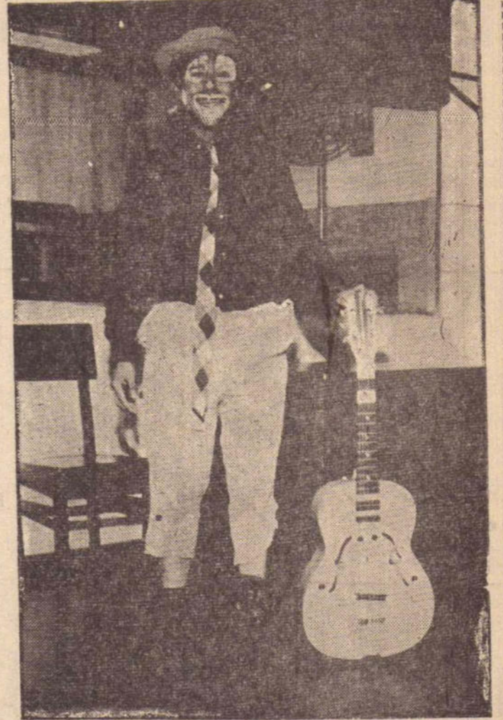
FAROFINHA — artista consagrado internacionalmente, através do rádio, televisão e cinema que vem se apresentando todas as quartas-feiras no palco-auditorio da Rádio Presidente Prudente, ZYR-84, com grande êxito. Farofinha que é cômico por excelência tem arrancado muitos aplausos dos que lá comparecem. Se você ainda não viu pessoalmente, vá vê-lo na noite da próxima quarta-feira. Ultimamente, Farofinha tem sido a grande atração radiofônica da cidade.