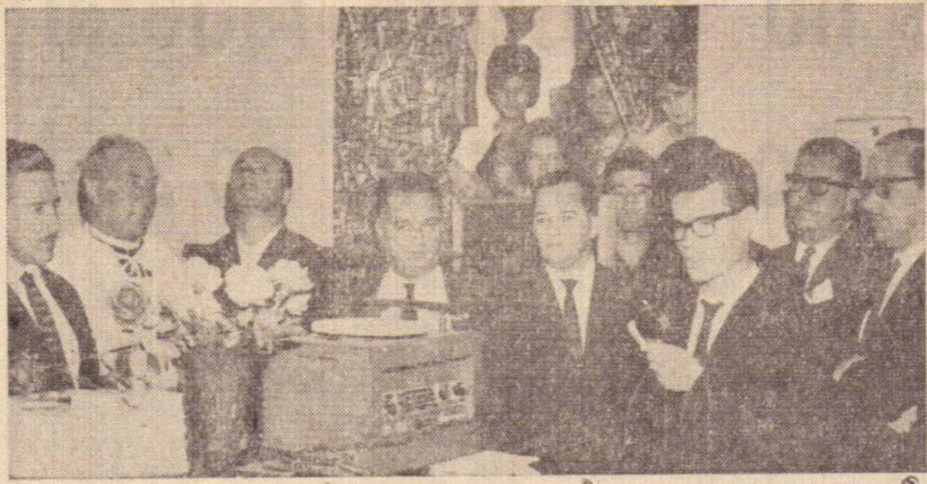
Isto é a fórmula secreta para eu entrar na Prefeitura de São Paulo.