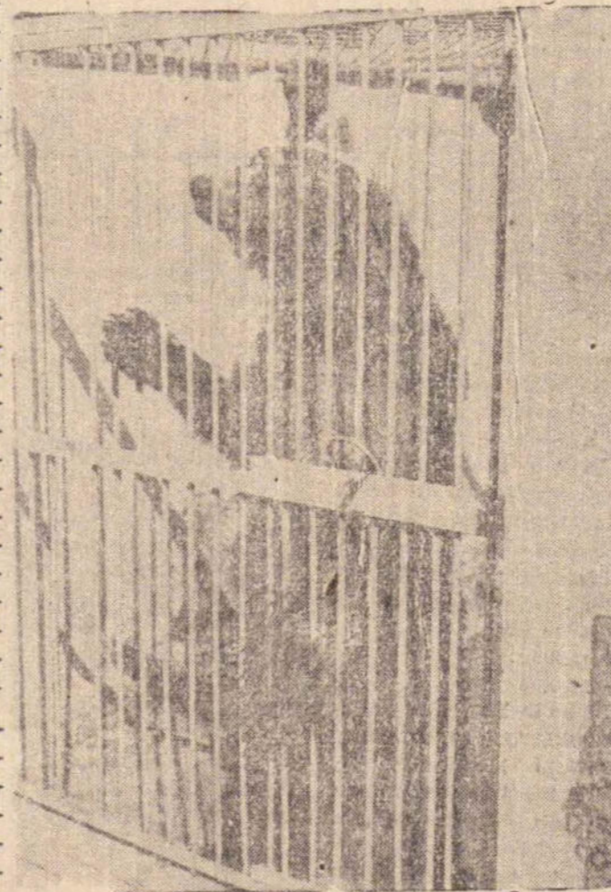
Podem chamar-me de urso. Sou mesmo. Embora preso, volto com minhas FOTOGOZADAS, Elas estão na página 4