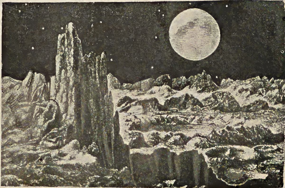
De la Luna a la Tierra o la realidad aproximada

En menos de un siglo, de la exaltación racional del individualismo hemos pasado a este horror irracional en boca de una mujer común. Pero mucho más lamentable que el énfasis oscuro de la negación femenina, es la negación lúcida, reflexiva, de quienes consideran anacrónica la subsistencia de la individualidad en un mundo al parecer condenado fatalmente a rechazar la peligrosa libertad relativa del pájaro en homenaje a la vida segura pero esclava del hormiguero disciplinado. FIN