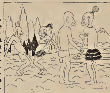
— Extravagante, esta danza. — La aprendieron en Europa.