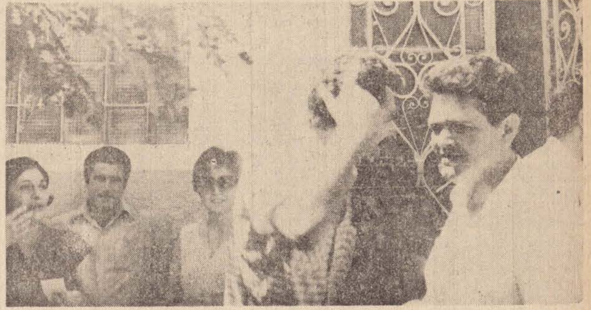
Na porta da Divisão de Ensino, os professores discutem seus direitos.

Cerca de 50 professores da Secretaria da Educação, compareceram nos últimos dois dias na Divisão Regional de Ensino para discutirem um acerto de contas, pois o Estado atribuiu as aulas dos que são celetistas a outros docentes, e está convocando todos os que são contratados por regime de CLT, propondo um acerto de contas na base de 60%.