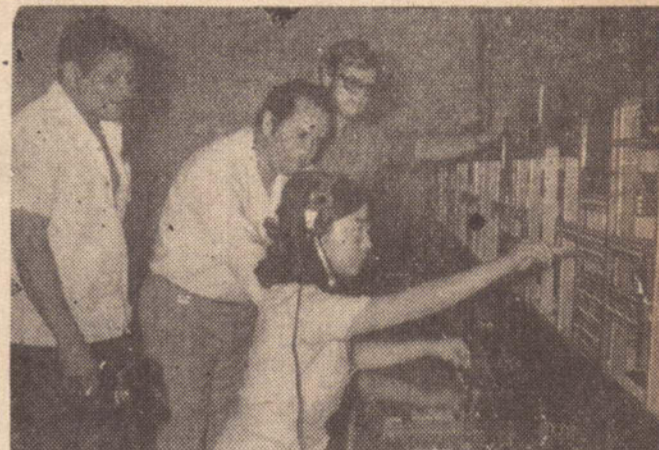
Em fevereiro, as novas mesas interurbanas já estavam em testes.

ou nos pontos de maior afluência popular. Aqui, ainda existem os telefones publicos, que certamente serão substituídos em grande parte pelos "Orelhões" mas quando?