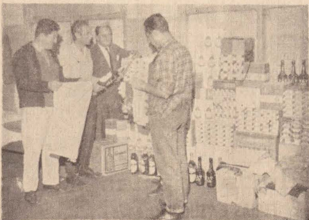
O material em ampolas, podendo ser aquilata a quantidade traficada.