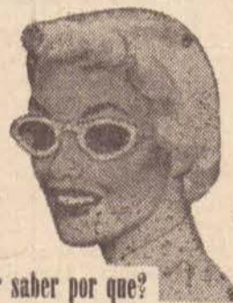
quer saber por que?