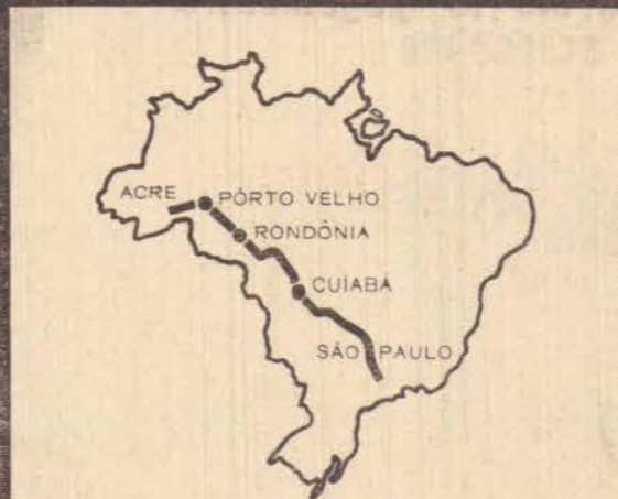
Antecipando-se à conclusão da BR-29, a caravana Ford percorreu todo o seu leito-piloto, travando contato direto com as gigantescas dificuldades com que se defronta a heróica engenharia brasileira, na conquista da selva.