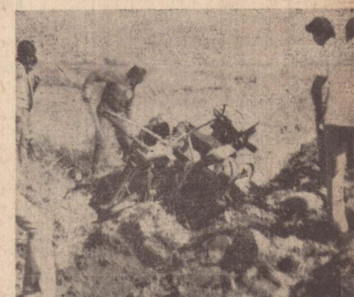
O micro-tractor Agrale faz de tudo: até curvas de nível, dispensando o tratorista.