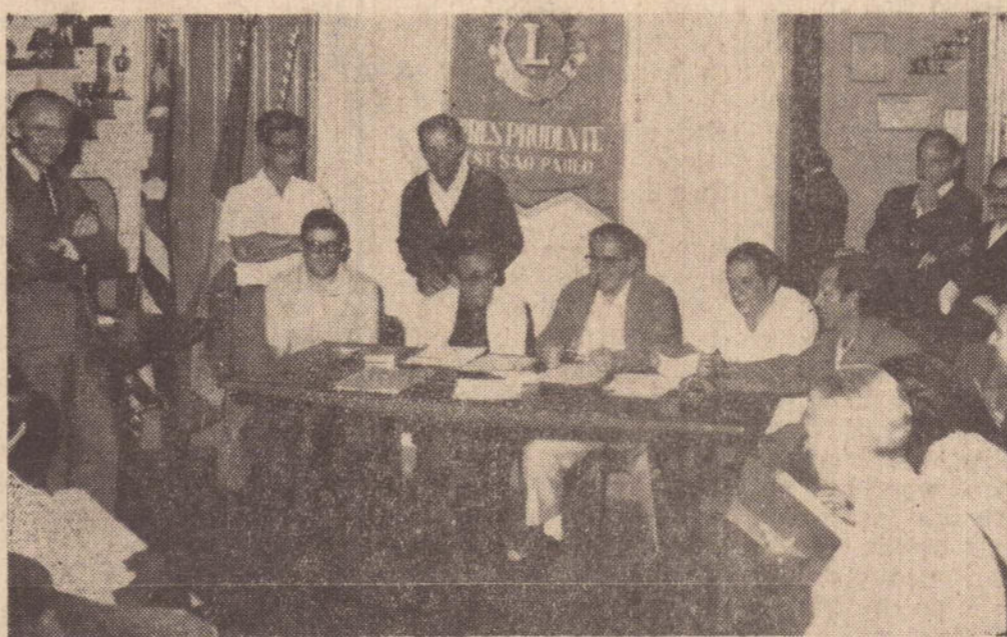
Dirigentes do Rotary e Lions de Pres. Prudente acertaram os detalhes da 3.ª Roly do próximo domingo, no San Fernando.