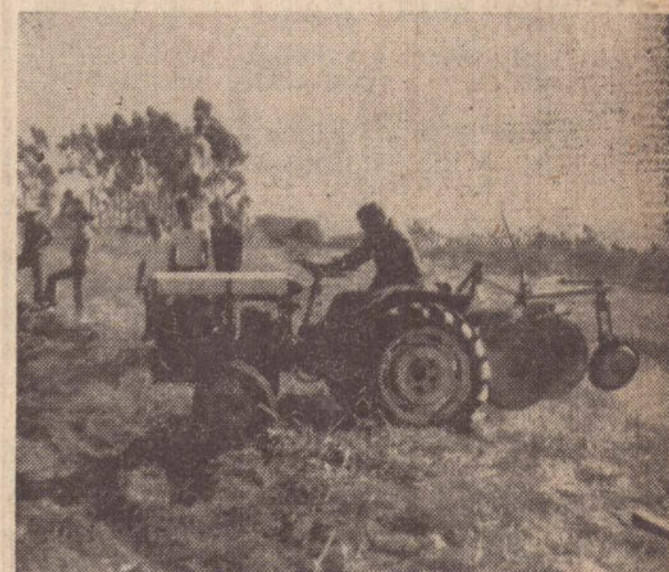
A demonstração prática foi exclusivamente para os futuros técnicos agrícolas.

Durante várias horas, a demonstração prática foi acompanhada com o máximo interesse pelos futuros técnicos em assuntos de agricultura, que ficaram vivamente impressionados com a versatilidade e desempenho do micro-tractor "Agrale", já denominado com muito acerto de "O pequeno". Os trabalhos foram também assistidos por diretores da nova concessionária regional, assim como, representantes da imprensa, convidados e técnicos da Agrale S.A. que mostraram a eficiência do micro-tractor na aração, gradeação e execução de curvas de nível em terreno ocupado por pastagens. Em determinado momento, o técnico que fazia a demonstração, deixou o volante propositalmente, a fim de provar que até sozinho o tractor continua trabalhando satisfatoriamente.