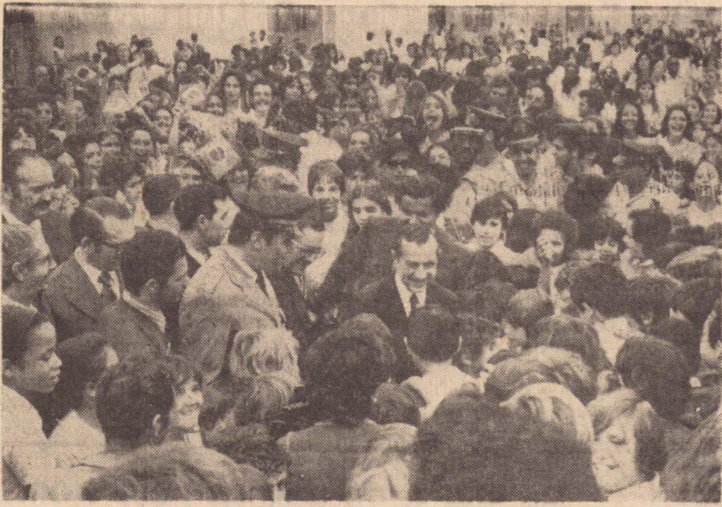
Laudo Natel, recebido por inúmeros populares, na Ponta da Praia, em Santos.