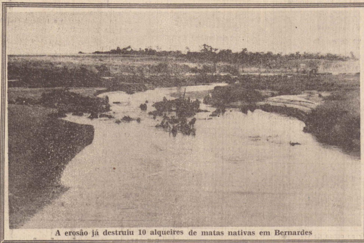
A erosão já destruiu 10 alqueires de matas nativas em Bernardes

Em diversos setores as crateras formadas pelas águas são extensas e se ampliam a cada chuva. Além disso toneladas de areia são depositadas pelas enxurradas sobre as lavouras e com isto vão sendo diminuídas as áreas aproveitáveis, levando desespero aos agricultores que se apressam em colocar suas propriedades a venda. Nos pontos onde ocorre o fenômeno, nem o capim consegue germinar direito conforme tentativas já feitas segundo o prefeito. Ele enviou em novembro correspondência ao Ministério da Agricultura a quem expôs a situação e pediu a inclusão imediata de Presidente Bernardes no Programa Nacional de Combate à Erosão, alegando também que os milhares de metros cúbicos de areia despreendida da região poderão