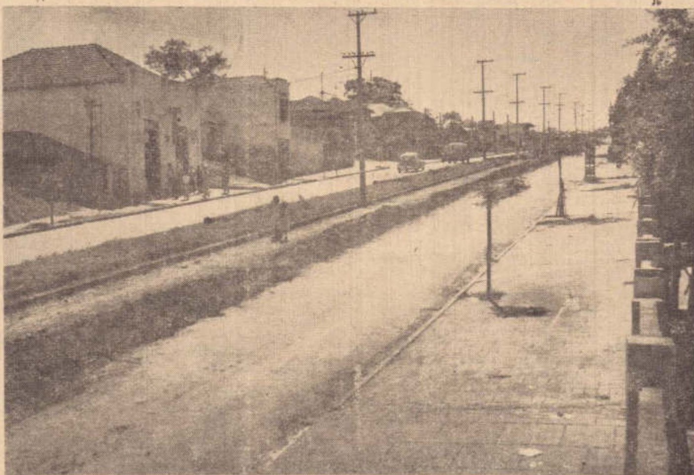
Está sendo atacado de rijo o Serviço de Águas de nossa cidade, abastecendo assim a população prudentina. No flagrante, vemos o trecho da Avenida Cel. Marcondes até ao campo da A.P.E.A., onde foram abertas as valas, para colocação de enormes tubos que forma o anel distribuidor de água, da cidade. Com isso vemos que a Municipalidade não para.