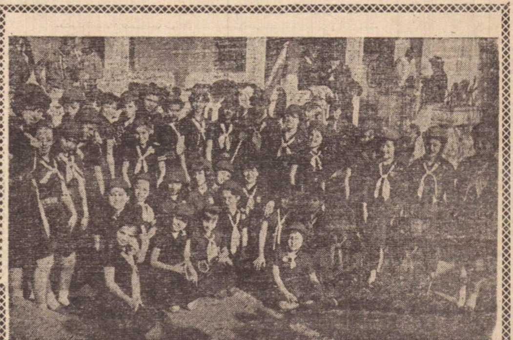
Flagrante da Companhia Local das Bandeirantes, Chefes, F.das e Guias, defronte ao SESC, onde localiza-se sua sede

da e votada, destacamos a que se refere a aprovação em 2.a discussão e redação (conclusão, na última página)