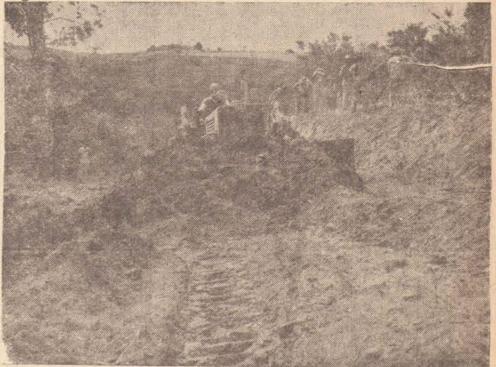
Aspecto do movimento de terra que está sendo feito para o alargamento da estrada que vai para Ameliópolis.

mais. Aliás, todos os candidatos da "Chapa Realidade" foram consagrados nos votos, tendo ganho em todas as categorias de cargos.