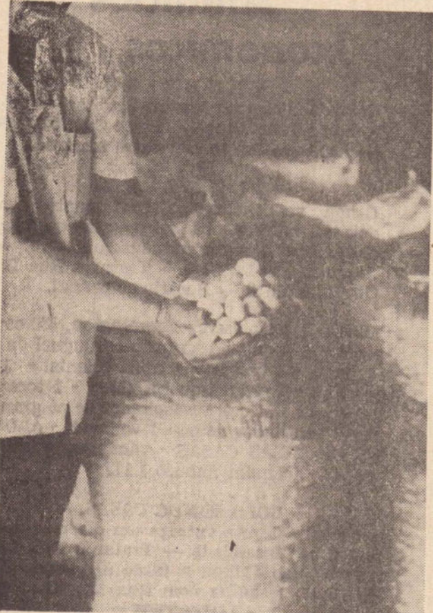
Satisfeito o lavrador exhibe a qualidade dos casulos hoje adquiridos por um bom preço