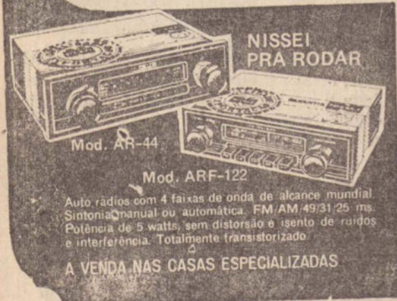
Mod. AR-44 Mod. ARF-122 Auto-rádios com 4 faixas de onda de alcance mundial. Sintonia manual ou automática. FM/AM 49/31,25 ms. Potência de 5 watts, sem distorção e isento de ruídos e interferência. Totalmente transistorizado.