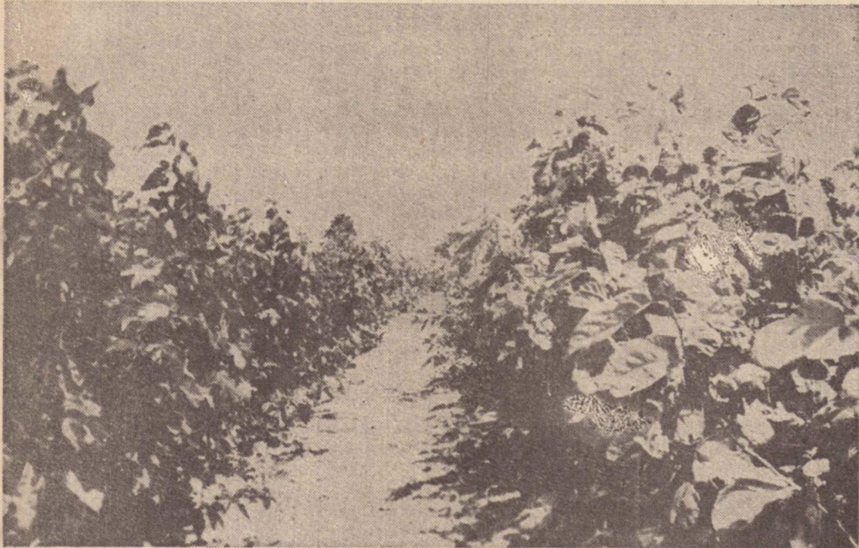
O município possui 97 alqueires de amoreiras cultura que também faz parte da diversificação agrícola imposta pelo prefeito Leonildo Denari.