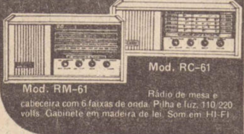
Mod. RC-61 Mod. RM-61 Rádios de mesa e cabeceira com 6 faixas de onda. Pilha e luz. 110/220 volts. Gabinete em madeira de lei. Som em HI-FI.