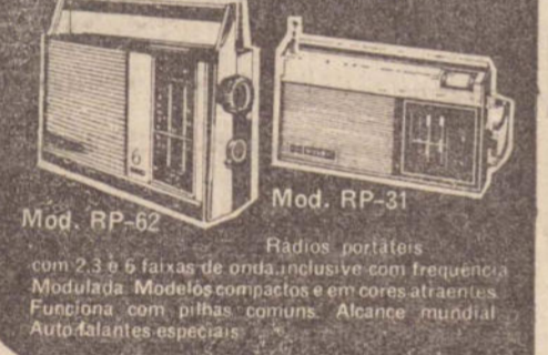
Mod. RP-62 Mod. RP-31 Rádios portáteis com 2,3 e 5 faixas de onda, inclusive com frequência Modulada. Modelos compactos e em cores atraentes. Funcionam com pilhas comuns. Alcance mundial. Auto-falantes especiais.

■ A Seleção Brasileira poderá ser convocada no final do ano para participar da festa do Dia do Atletas, 17 de dezembro, no Maracanã. Brandão declarou que depois de conhecida a relação dos 16 jogadores que comporão a seleção da CEF que enfrentará o campeão do Brasil, ele pretende relacionar mais 16 atletas e que a sua seleção poderá fazer a preliminar contra a Seleção de Amadores que vai disputar o pré-olímpico.