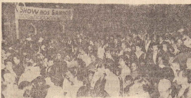
Grande público no Jardim Planalto

O "show nos bairros" é uma iniciativa muito válida e merece o apoio das autoridades responsáveis pelo setor de cultura do município, pois cada apresentação reúne um número muito grande de pessoas e o público aplaude vibrantemente os nossos cantores. Segundo "Capuá", o show já foi realizado em dezoito bairros da cidade.