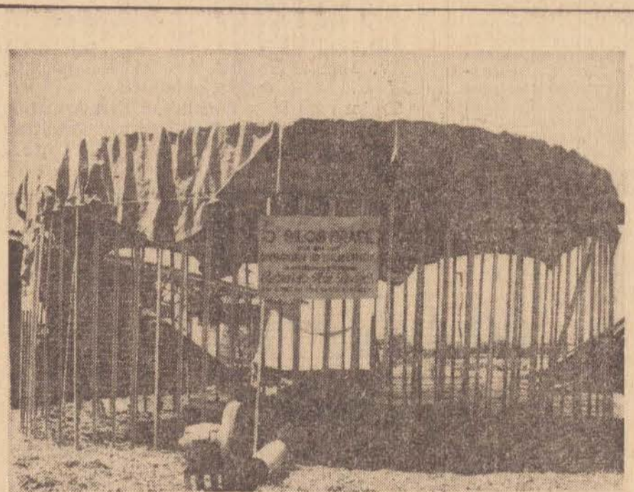
Utilizando Encerado Locomotiva na cobertura externa e tecelagem na parte interna, o Silo Granero é o mais eficiente meio para a estocagem de cereais.

Este é o significado das palavras: "Quando o Espírito de Deus entra em vibração e se manifesta com Palavra, desenvolvem-se todos os Fenômenos e realizam-se todas as coisas".