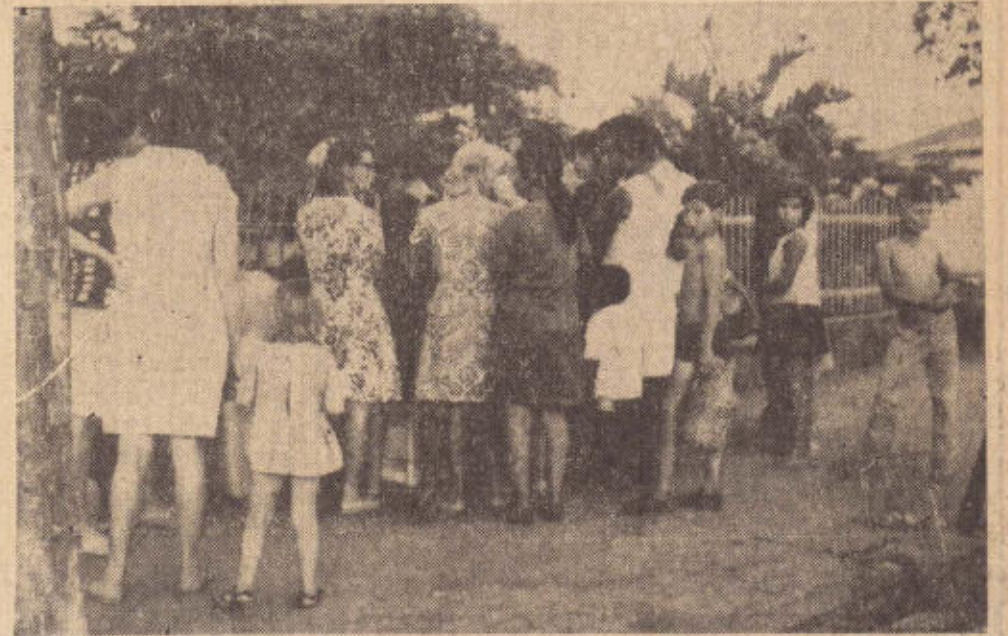
Junto às fontes, houve até concentração de pessoas em busca do precioso líquido.

Busca ao precioso líquido Há três dias vem se formando filas intermináveis e junto às fontes de água potável que abastecem a cidade. Como se não bastasse esse problema decorrente de um maior consumo do precioso líquido, começou a faltar água em vários pontos da cidade. Como de hábito, o Depar-