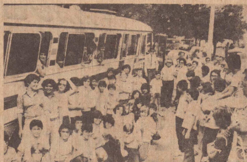
Os alunos, numa pose especial, momentos antes de embarcar pelo ônibus da Andorinha.

de livre para fazer compras. No momento de embarques e os alunos felizes que os pais estavam presentes e os alunos felizes simos pela viagem.