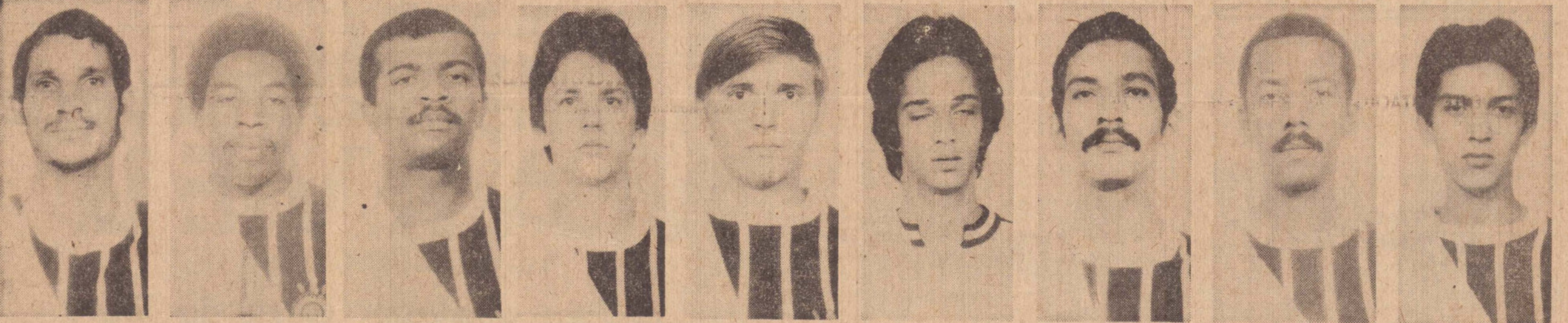
Jayme meia armador (Revelação) Edu Extrema esquerda Djaima zagueiro de area Ratinho meio campista Mauro atacante Nilson arqueiro reserva Mau zagueiro Periquito zagueiro de area Zé Roberto atacante