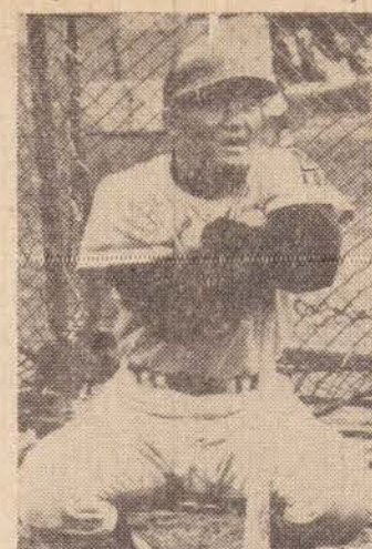
Isao Harimoto — Pelé japonês do Beisebol