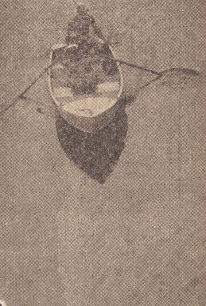
ASSIM trabalhou o Corpo de Bombeiros, inclusive com mergulhadores, no leito do rio Tietê. As buscas foram infrutíferas.

De Ourinhos, vem a notícia de que a abstenção não foi grande, dando conta de que do comparecimento dos 17.232 eleitores inscritos, ficou assim distribuído: Ourinhos, com 11.502, compareceram 9.224, provocando 19,80%; Canitar — distrito de Ourinhos — com 544 eleitores, 361 votaram, com 33,63% para Xavantes, a