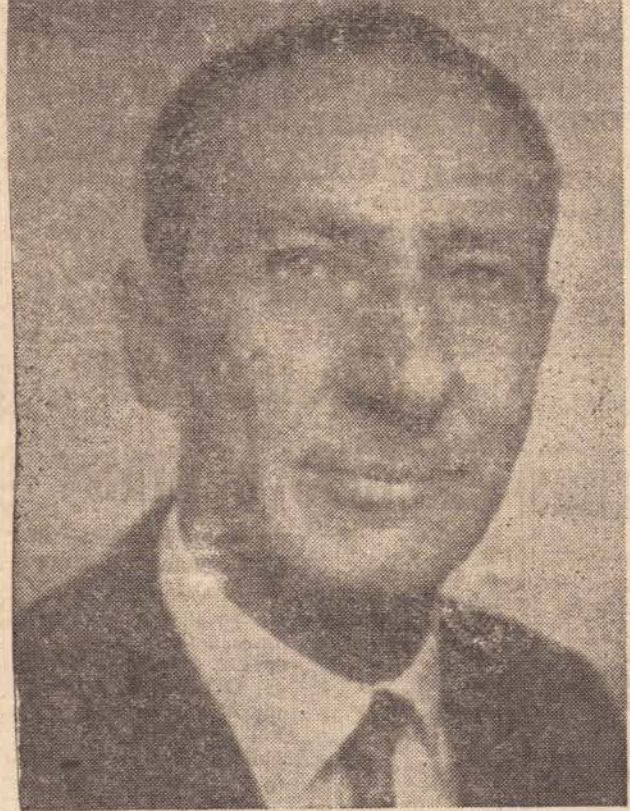
Empresário da Temporada Internacional do Baseball Profissional