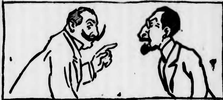
Luciani: — Mi pare che tu non sappia fare! A quest'ora lo avrei già pianto in pubblico quattordici volte almeno!

giusto, ma osservatore superficiale delle cose, atteso fatalmente a questo: