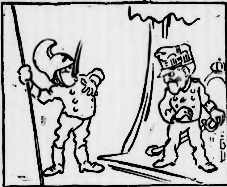
Vittorio: — Gesù Maria!... Ma da quale manicomio sarà scappato costui?

ri o cambierebbero sistema o non uscirebbero più di casa.