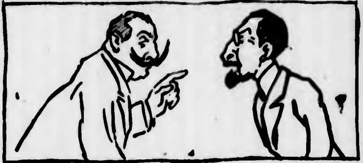
Luciani: — Mi pare che tu non sappia fare! A quest'ora lo avrei già pianto in pubblico quattordici volte almeno!

giusto, ma osservatore superficiale delle cose, arriva fatalmente a questo: — Una delle due: O « Fulano » ha preso una lettera, oppure è... un ladro! Né una cosa, né l'altra. Il « Fulano », di cui si mediana è semplicemente un fedele cliente della TINTURARIA MARTELLO, Galleria de Crystal, 19; motivo per cui, benché di condizione modesta, stoggia un leno, solo concesso al... «grados».