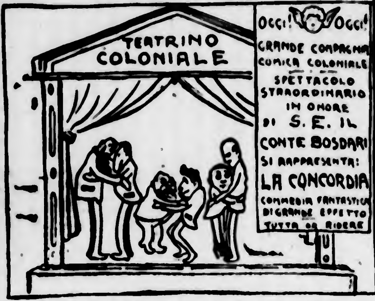
Se ne vedono tante in colonia, che si può vedere questa!

Queste cose le facciamo solo noi italiani! E' la nostra specialità!