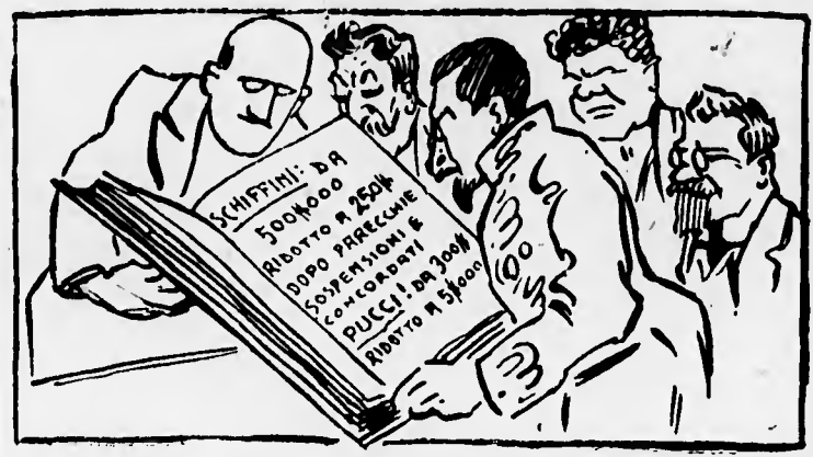
Ermelino: — Come vede la colonia non smentisce mai la propria generosità!