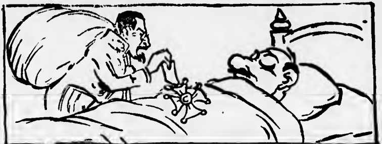
...nel sogno dei patrioti coloniali.