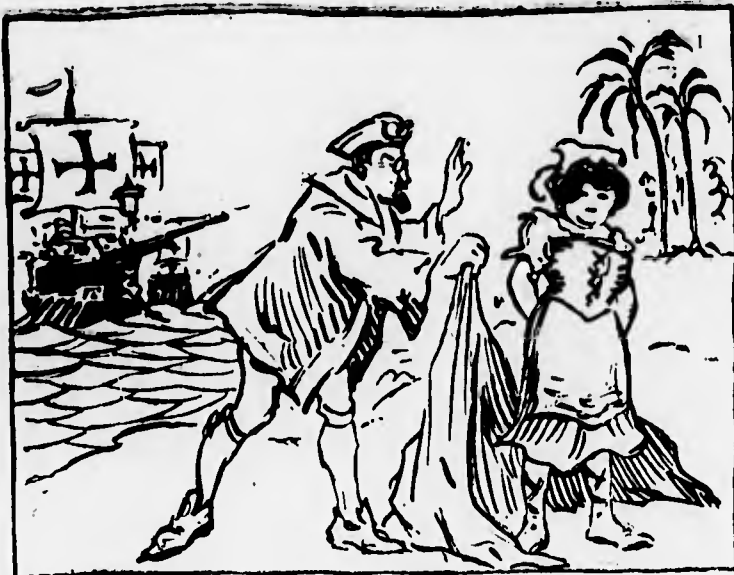
Bosdari: — Che bel tocco di ragazza! Non capisco come abbiano fatto a non accorgersene prima!...

(«Si può dire, adunque, che S. E. venga a scoprire la colonia italiana di S. Paolo, finora mai conosciuta in Italia e che la guerra ha rivelato» — Dal Fanfulla .)