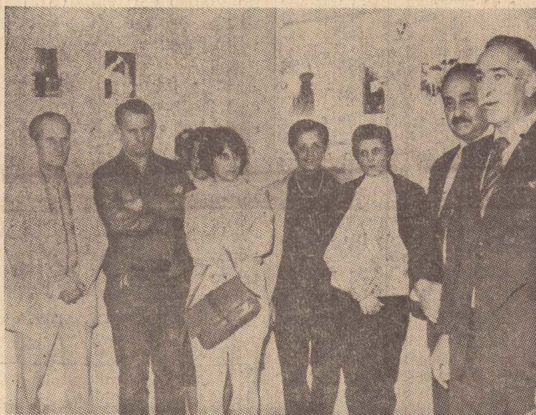
Na abertura do 1º Salão, domingo, o prefeito falou sobre a importância da promoção de O IMPARCIAL

Até dia 31 deste mês estarão expostas no Palácio da Cultura, as dezenas de fotografias participantes do 1.º Salão de Fotografia de Presidente Prudente, cuja abertura deu-se domingo a noite com a