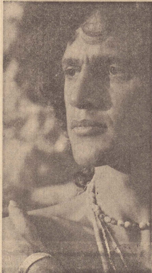
Caetano será um dos patronos no "Vestibular da Canção".