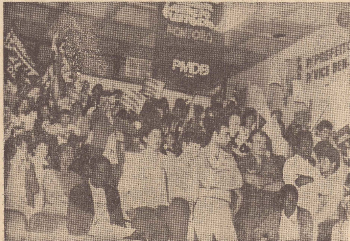
Os líderes peemedebistas acreditam que pelo menos 3 mil pessoas passaram pela Câmara Municipal, onde se realizou a convenção.

Agora, faltam apenas o PDS e o PTB o lançamento de seus candidatos ao pleito municipal de novembro.