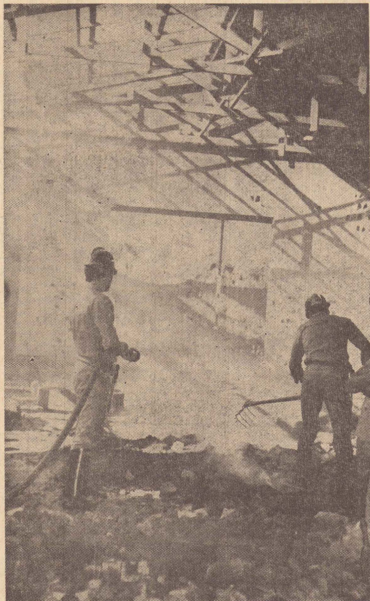
A população vizinha assustou-se com o incêndio.