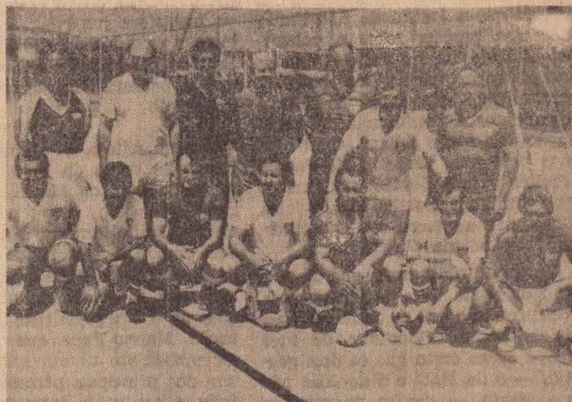
Elementos do Conselho e Diretoria que estarão em ação dia 16 na inauguração do Campo de Futebol Suíço.

O jogo tem o seu início previsto para as 20 horas, e todos os associados estão sendo convocados para prestigiar o acontecimento. Logo após o jogo o Estádio de Futebol Suíço, será entregue aos Associados.