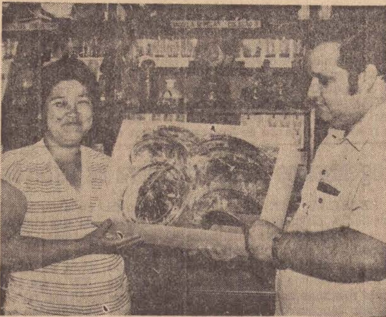
Mais um brinde oferecido pela CASA DAS LOUÇAS E TRAMONTINA