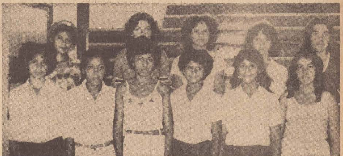
Elas pagavam ao chefe do departamento pessoal da Lotus, Cr$ 500,00 por mês, para não serem despedidas.

Segundo o prefeito Wadi Jorge, o local que agora volta a ser pesquisado, já produziu asfalto de excelente qualidade, utilizado para pavimentar ruas em municípios como Bauru, Pie. Prudente, Botucatu e Curitiba. "Acho que agora eles vão afinal descobrir o petróleo, pois que existe aqui em abundância todo mundo sabe", afirmou o prefeito.