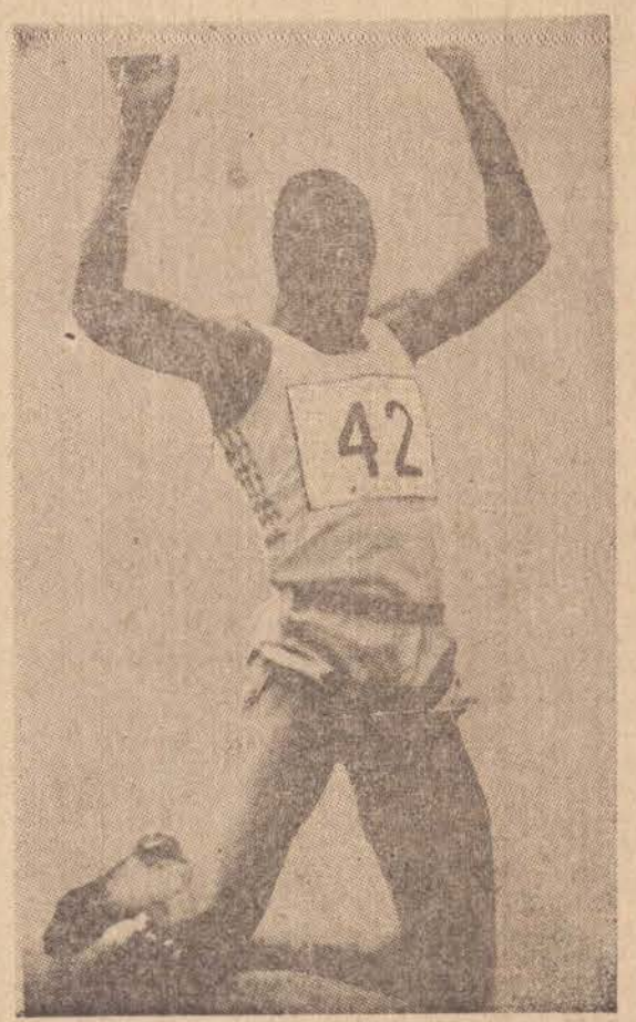
João do Pulo, recordista mundial do salto triplo.