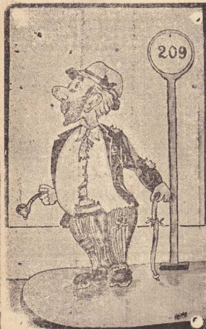
CIDADÃO ESPERANDO UM HELICÓPTERO PARA DAR UMA VOLTA PELAS RUAS DA CIDADE

— Previi já que os buracos transformam-se nos Cinôn... fazendo concorrência ao Rio Colorado nos Estados Unidos.