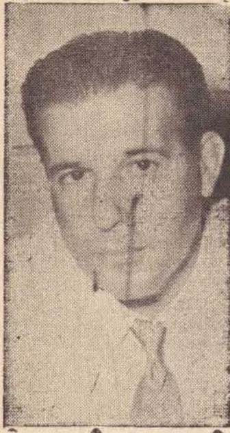
João Goulart presidente da República