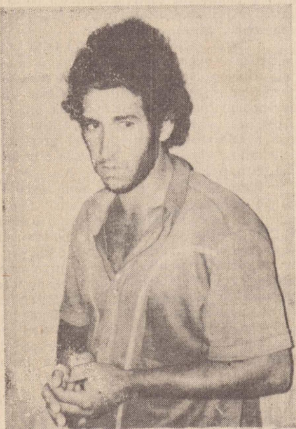
"Paulistinha", o assassino de "Balaninho"

Melegassi que tem 20 anos, é solteiro e disse que sua família mora numa casa próxima a Delegacia de Polícia de Colorado (PR), agiu em Prudente das 9 às 11 horas de sábado. Pretendia fugir após o meio dia, quando o comércio já estivesse fechado.