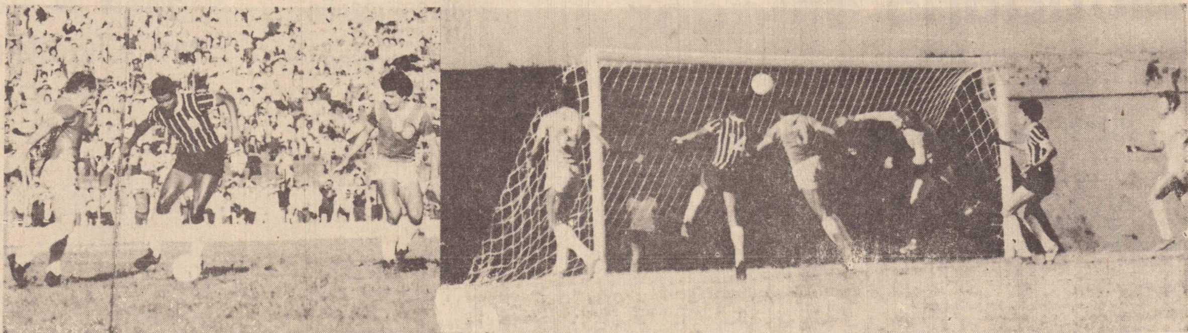
Dadá domina o balão, perseguido pelo veterano Benete, grande figura do time de Araçatuba.