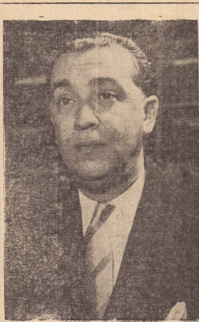
JK AMANHA EM SÃO PAULO