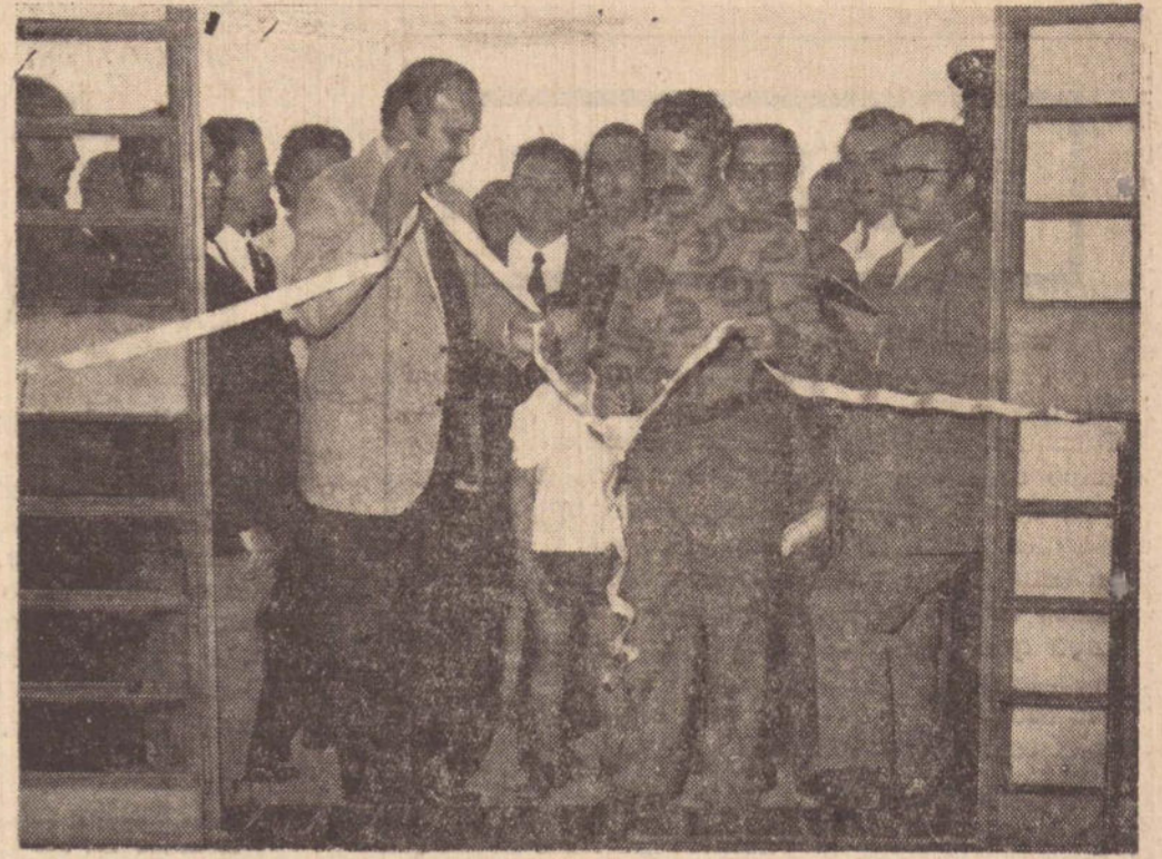
O diretor do FECE inaugura o prédio do Colégio Estadual na "Cidade Verde"