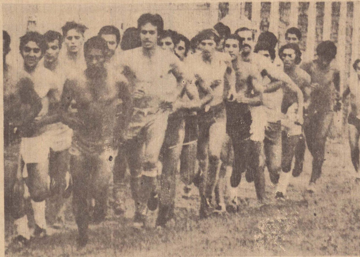
Este é o jovem plantel do Corinthians PV, clube que já revelou grandes valores para o futebol paulista.