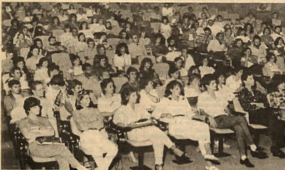
Em Araraquara, muita gente foi ao auditório da Faculdade de Odontologia