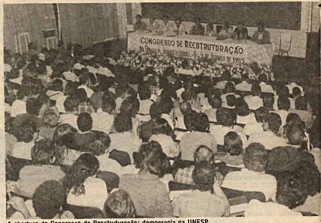
A abertura do Congresso de Reestruturação: democracia na UNESP

Um dado relevante foi o empenho da Comissão Local e funcionários do Campus de Jaboticabal na realização do Congresso. De outro lado, duas frustrações: 32 delegados não compareceram e, em algumas decisões, o corporativismo acabou se sobrepondo à questão maior do Congresso, que era a de reconstruir a UNESP efetivamente voltada para as necessidades da sociedade brasileira.