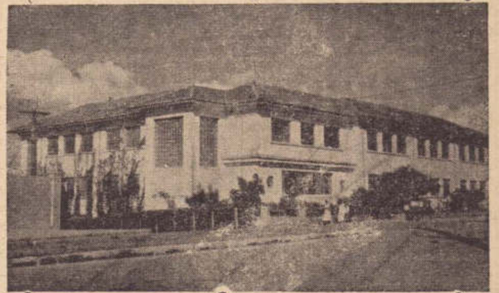
Eis a fachada do Instituto de Educação Fernando Costa

contribuir para a conclusão rápida desta obra, a fim de que, já em 1962, entre em funcionamento a laminação de aço de V. Redonda. Com os recursos que serão assegurados, a usina poderá estar concluída definitivamente em 1964. Asseguraremos os recursos necessários, porque é ponto de honra do governo da República através do BNDE contribuir com financiamentos para efetivação de obras desta natureza em qualquer rincão do país desde o Amazonas ao Rio Grande do Sul. E o que faremos. Nesse sentido, temos solicitado aos governadores de todos os Estados que apresentem projetos que visem a efetivação de obras que realmente possam contribuir para o maior desenvolvimento econômico do país".