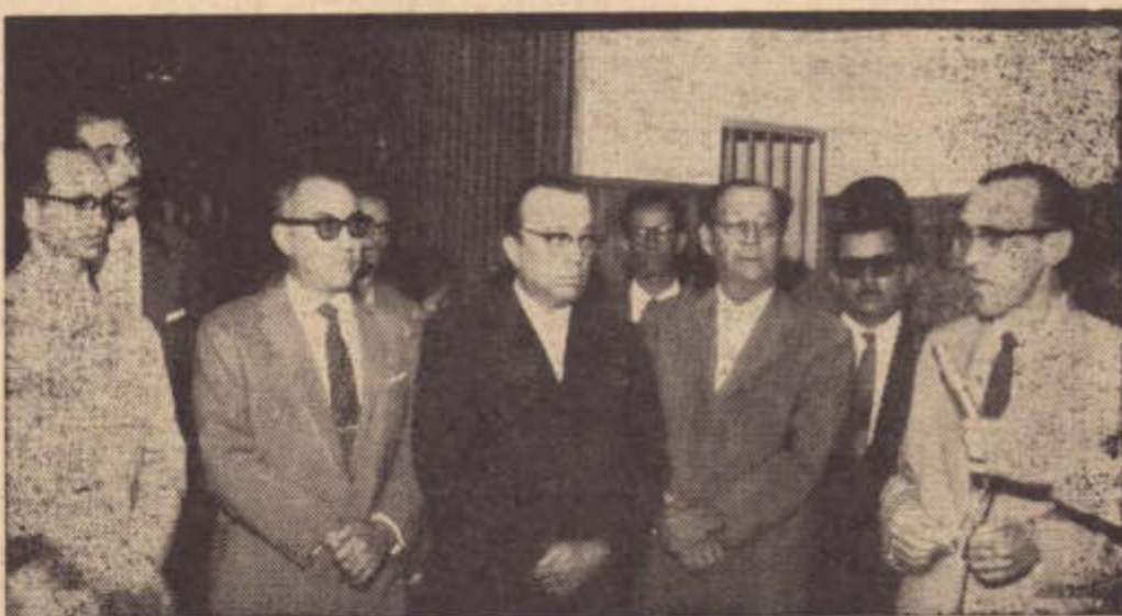
Um flagrante da inauguração da Agência do Banagro em Pres. Prudente, no dia 3 do corrente passado, onde nota mos alguns diretores e convidados.

Cr$ 600.000,00, destinado a melhoramentos em estradas municipais.