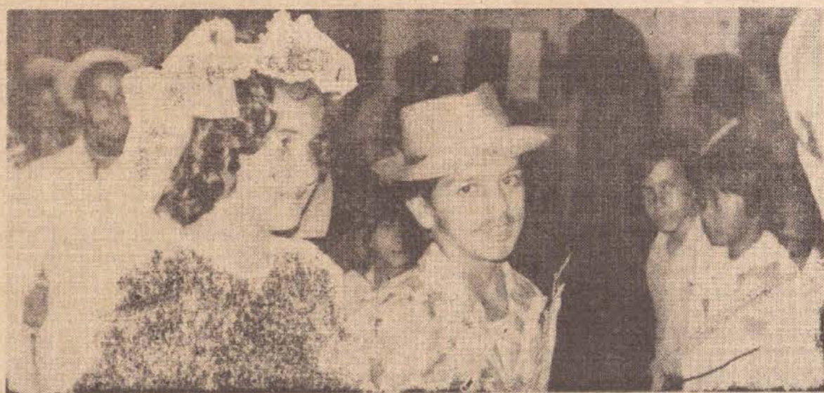
O casamento caipira