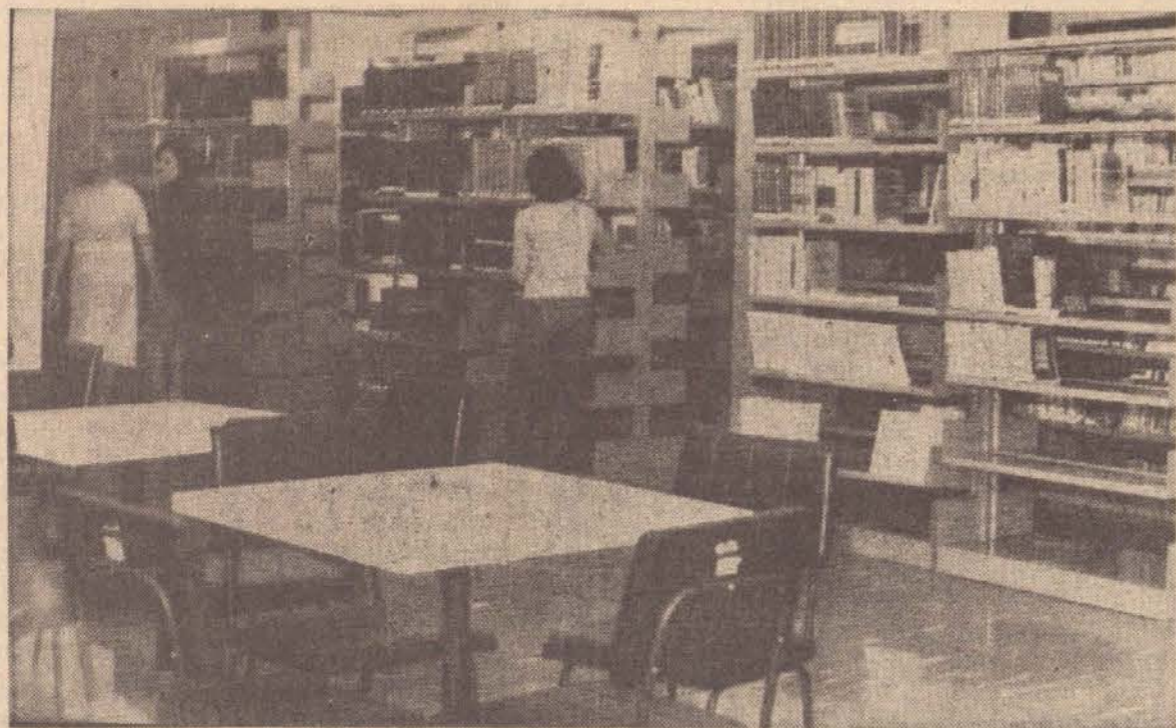
Presidente Prudente pode orgulhar-se agora de sua biblioteca pública.