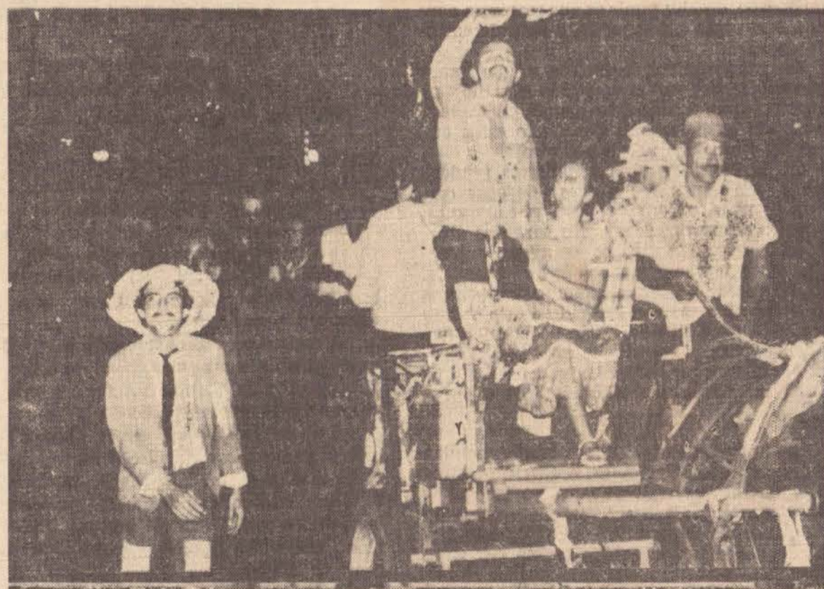
O cortejo foi grande, diversos troles, carroças, enfeitadas, e na foto, num deles, os padrinhos dos noivos. Foi uma festa que movimentou a cidade, e teve um final consagrador no próprio lar.

A comissão organizadora agradece a todos que deram valiosa colaboração para o êxito do evento, e às firmas que deram mimos para as Bonecas — Floricultura Vitoria Regia, Lojas Kawasaki, Lojas Center, Casa Akaki, Shopping China e Mônica Brinquedos.