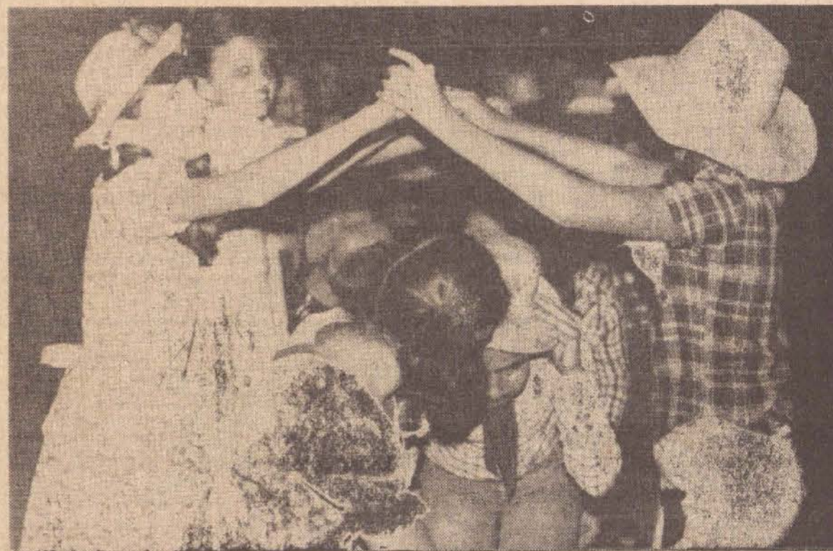
A passagem pelo tunel