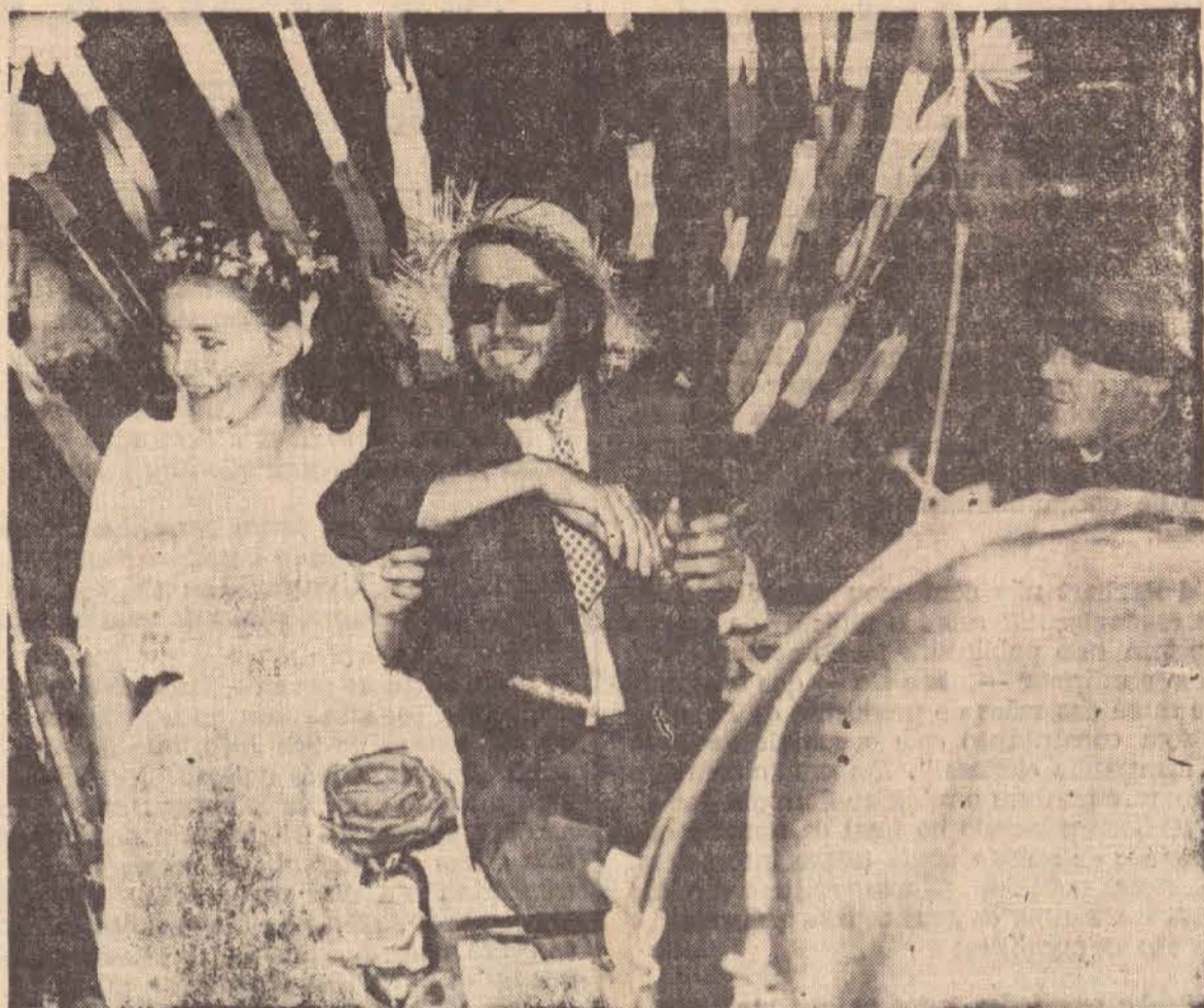
Os noivos alegres, um trole muito bem ornamentado quando desfilavam pelas ruas da cidade. Ao lado, dos noivos, o padre. Eles receberam muitas palmas durante o trajeto.