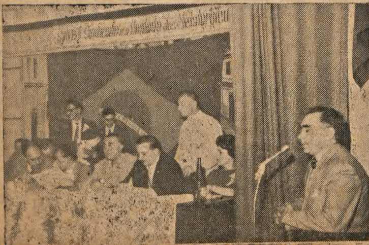
1960 Conferência Sindical dos Trabalhadores