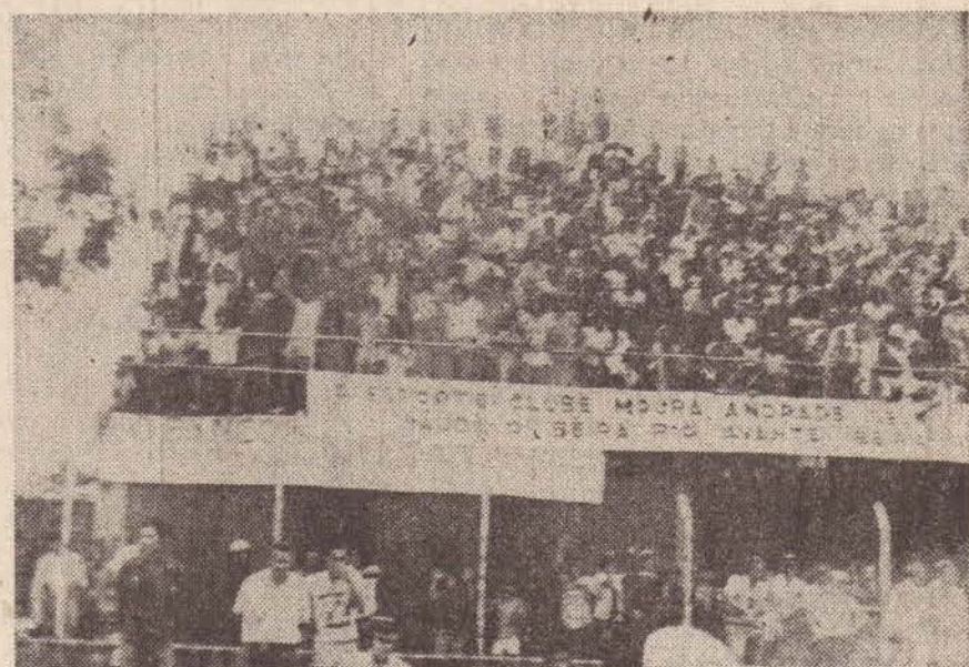
Na excelente campanha do Beira Rio, a vibração da torcida.