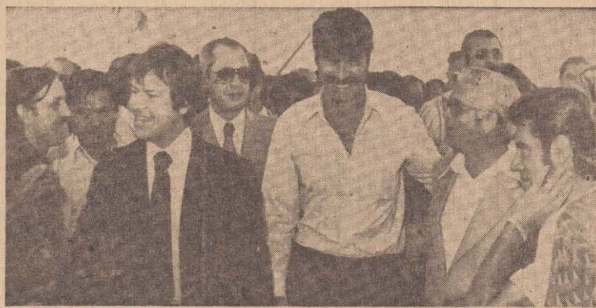
à recepção ao presidente da Caixa, no aeroporto internacional de Presidente Prudente.