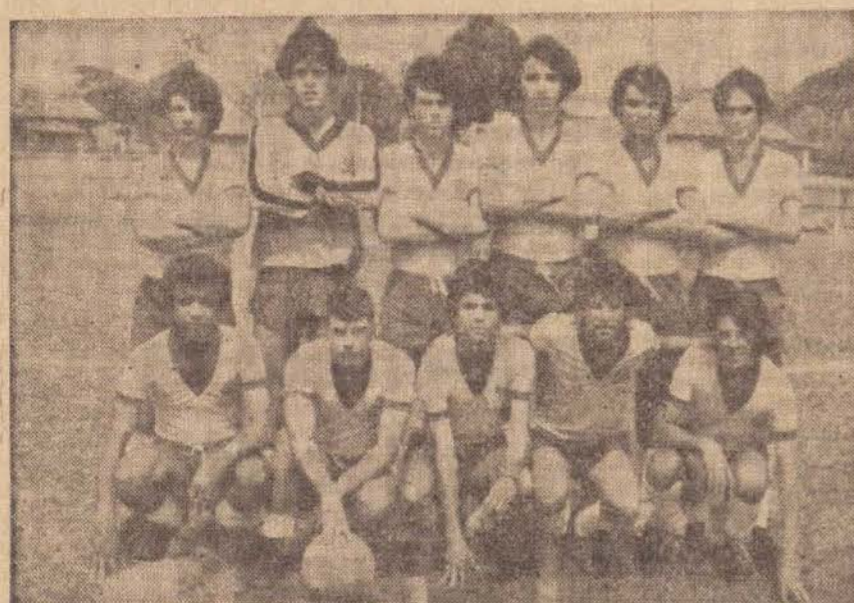
Equipe da Gráfica Depieri

dade de Presidente Epitácio e Associação dos Empregados da Caiuá de Presidente Prudente.