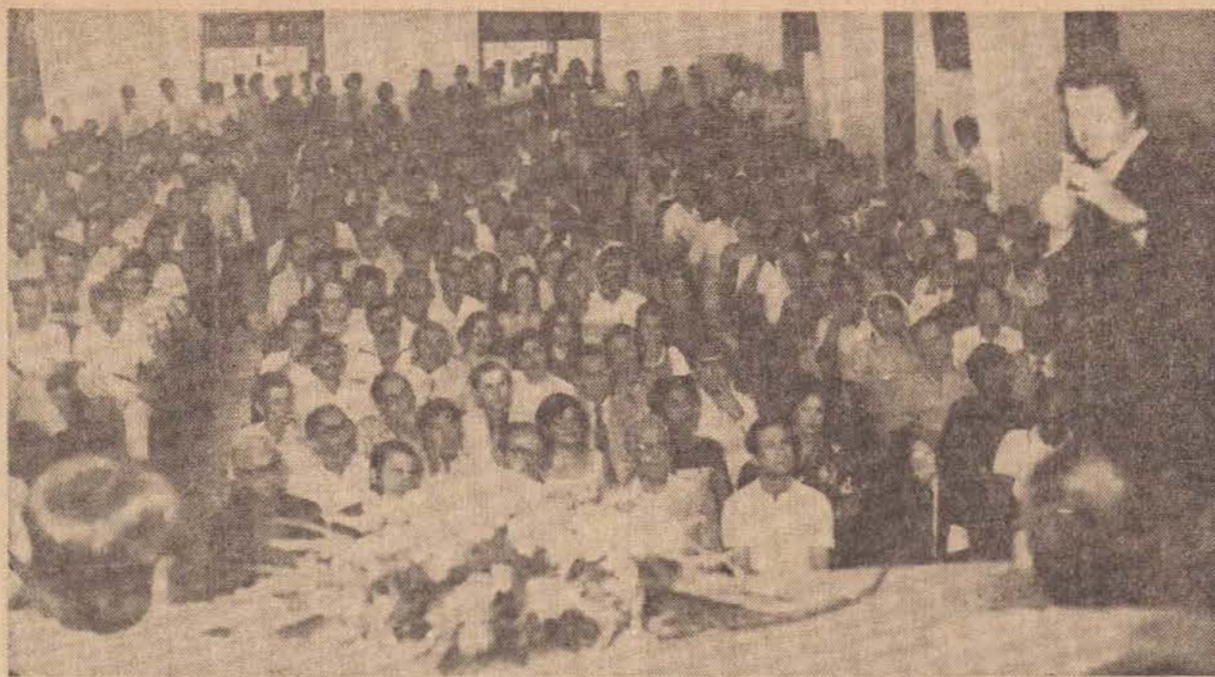
O contato com centenas de prefeitos, no auditorio da Instituição Toledo de Ensino.