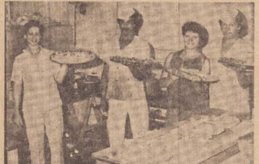
A equipe da cozinha, pronta para servir. Tudo o que há de moderno está instalado para melhor servir os "hábitus".