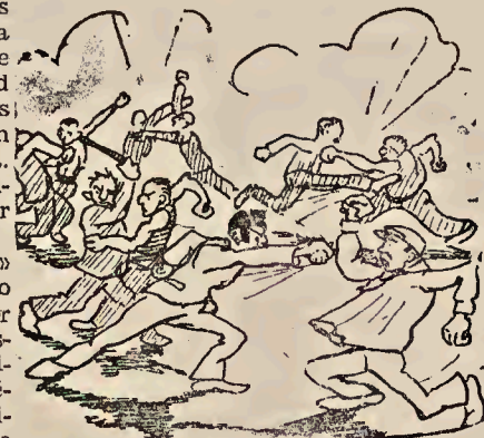
Quando el humor y la razón faltan...

No se ignore que para ser humorista verdadero se necesita disponer de fortaleza moral efectiva,