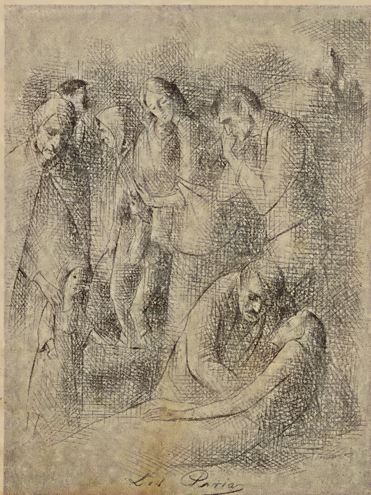
LOS PARIAS. Dibujo de Monrós