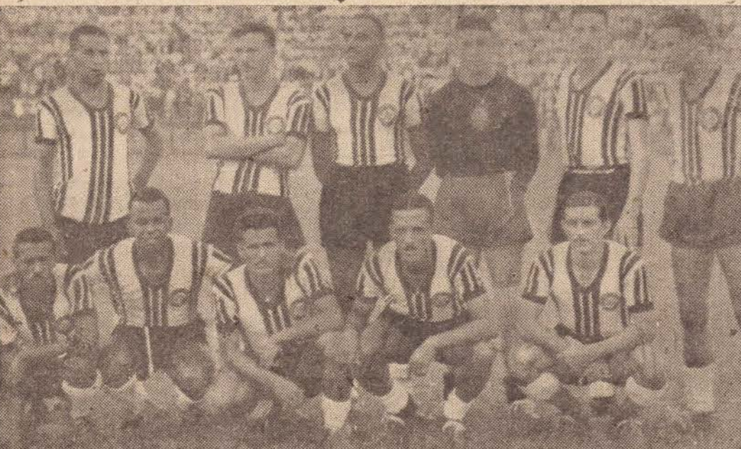
"AI QUE SAUDADE EU TENHO"...