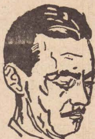
JÂNIO: CHOFER DE MUNHOZ DA ROCHA

O pleito do Paraná — em que se apontará o sucessor de Ney Braga — está ganhando notoriedade nas esferas nacionais. Os jornais de São Paulo numa notícia curiosa — e mesmo atentatória aos trabalhos da revolução — dão à guisa de picardia a possível participação do sr. Janio Quadros ao lado do sr. Munhoz, figurando como seu motorista particular, durante a campanha que já está se desenvolvendo. Resta esperar o retorno de JQ (foto) de Londres, onde foi submetido a uma segunda operação num dos olhos.