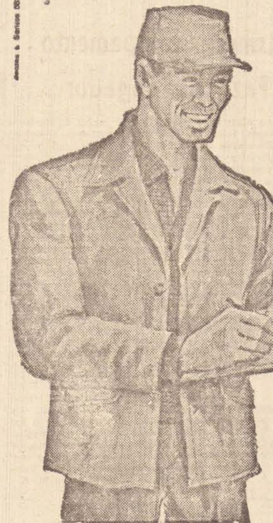
Aracajú - 3 de Junho de 1965

Astenia Sexual? TONOKLEN (Comprimidos) Produtos do Lab. Vita Ltda. Caixa Postal, 4-Tijuca-Rio