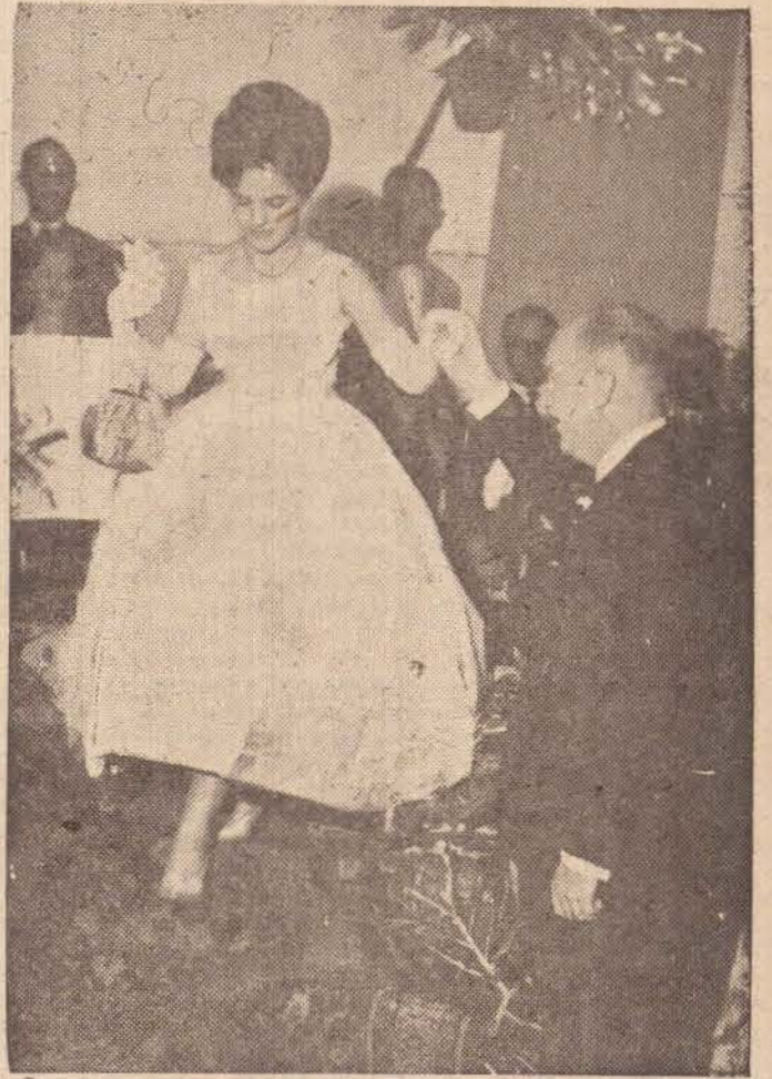
A FOTOGRAFIA É A NOTICIA

Desde que, no últimos tempos, é constante, por parte dos lavradores, a reivindicação ao governo, no sentido de melhoria geral e ampla, na garantia de preços dos produtos (conclui na última pag.)