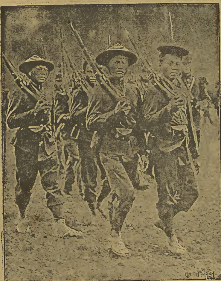
Vorbeimarsch der annamitischen Schützen.

sein. Der biedere Hotelbesitzer war ziemlich ratlos, aber schließlich entschloß er sich, wenn auch zögernd, dem Dichter die Blumen zu geben, der nun mit dem Strauß zufrieden sein Zimmer aufsuchte, um sich zur Ruhe zu begeben. Die Sache wäre damit erledigt gewesen, wenn der Hotelbesitzer nicht kopfschüttelnd gedacht hätte: „Was soll das heißen: ins Fremdenbuch trug sich dieser Herr anders ein, nachher wollte er auch Bergeret heißen! Rätselhaft, höchst verdächtig!“ Dahinter mußte irgend eine „Peufelei“