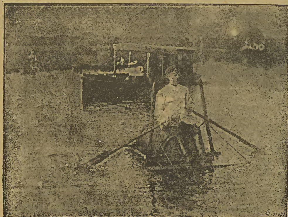
Ein Momentbild von den Kavallerie-Pontonierübungen auf der Oberpreze. Die alljährlich vor Beginn der Herbstmanöver fahrenden Kavallerie-Pontonierübungen auf der Oberpreze statt, bei denen es galt, in möglichst kurzer Zeit Behelfsbrücken für den Uebergang über den Flußlauf zu bauen. Für diese Behelfsbrücken, die naturgemäß nur eine geringe Tragkraft haben, so daß sie nur von den Mannschaften selbst überbaut werden können, während die Pferde an der Erde geföhrt, nebenher schwimmen, findet das mannigfaltigste Material Verwendung. Aus den nächstgelegenen Ortschaften werden Bögen und Abstellstüde aller Art herbeigebracht und aus ihnen Lauffest konstruiert. Ackerstroh, schwimmendes Material wie Kacksteine, Kackschirre, mit wasserfesten Stoffen überzogene Strohhäute, Bierfässer und Baumstämme werden mit Stricken untereinander befestigt und mit Brettern belegt, auf denen das Ueberfahren dann vor sich geht. Unter Bild zeigt einen Kavallerie-Pontonier, der sich aus einem angebotenen Bierfasser ein paar Stangen und einem Brett als Fußstübe einen sicheren „Ginger“ konstruiert hat, auf dem er vergnüglich über den Fluß rudert.

krankheit, die besonders die Kinder sehr herunterbringt. Der Arzt muß offen gestehen, daß die medizinische Wissenschaft dem Keuchhusten gegenüber bisher ziemlich machtlos war. Arzneimittel werden beim Keuchhusten zwar angewandt, aber der Nutzen, den sie bringen, ist stets sehr gering.