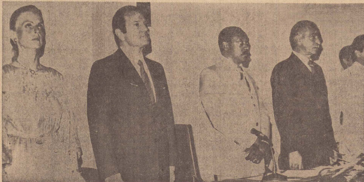
O homenageado ao lado da esposa e demais autoridades, na mesa principal