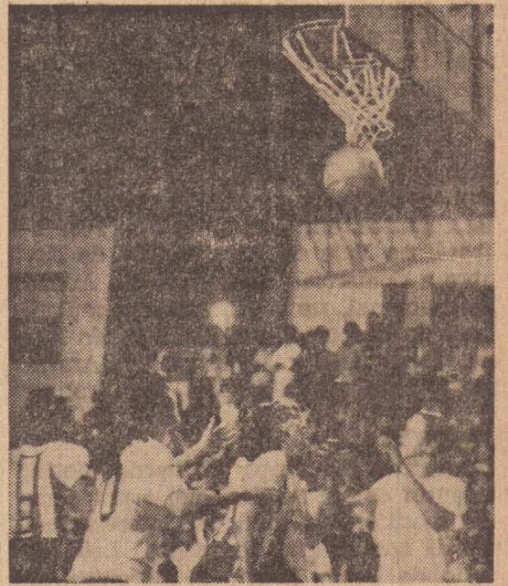
Prudentina/AMEPP lidera o Campeonato Paulista de Basquetebol Feminino Adulto.Divisão Especial