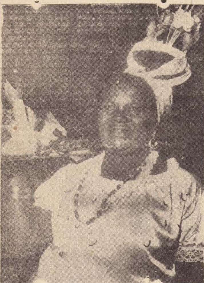
"Se o SOMBRINHA não pegar o primeiro prêmio, eu faço um "despacho" contra o Florivaldo e e ele se azará!..."

Contra o CORINTHIANS, no duro, é o Aprigio. Ontem ele dizia: "se o Corinthians jogasse contra os COMUNISTAS, eu torceria para os COMUNISTAS!..."