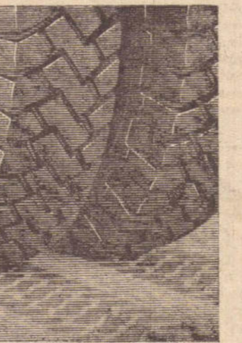
pela marca está se vendo:

Dezenas de animais são diariamente presos pelos funcionários da municipalidade, tais como cabras, cavalos, bois, cachorros, etc.