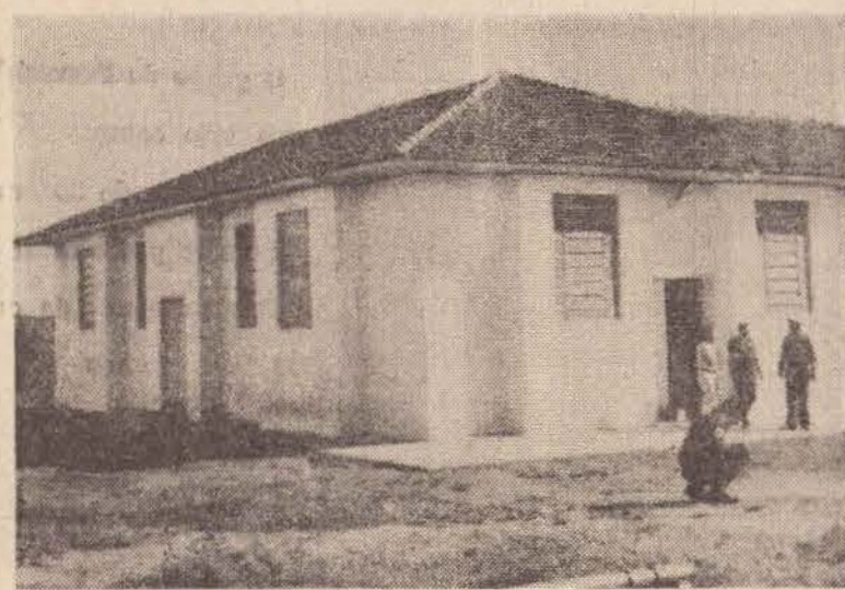
Este é o prédio onde funcionará a sede do Tiro de Guerra