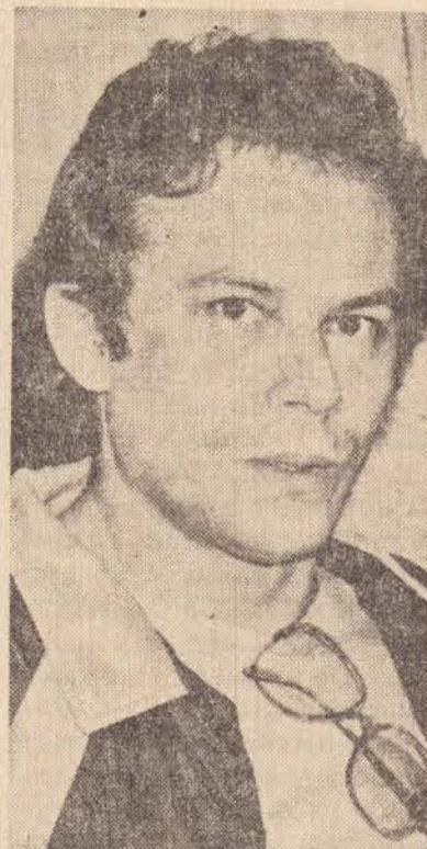
“QUEM AMA NÃO MATA”

Com oito novas personagens e algumas modificações começou a ser gravado na Cinévia “Chico Anísio Show”, programa que estréia em março, indo ao ar todas as quintas-feiras. Entre tipos especialmente criados para o programa estão: Chiquitin, Bruce Kane, Biu, Coronel Ventura, Nicanor, Simplício, Vó Zefa e Maria Bahiana. Ao lado dessas novas personagens, “Chico Anísio Show” traz ainda várias das antigas, como a Salomé — agora com mais poderes, além do telefone — e Roberval Taylor, o locutor de rádio, estreando na televisão com o “Jornal do Roberval”.