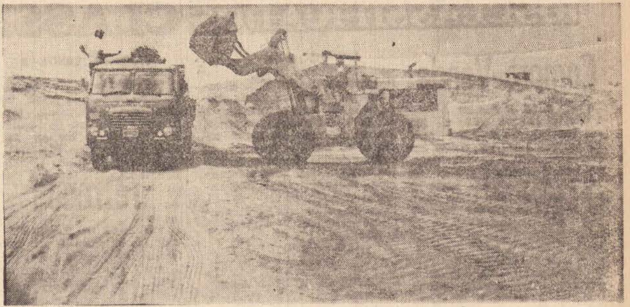
O carregamento no Porto de Areia Marajá é feito por pás-carregadeiras o que garante um atendimento rápido e eficiente aos camioneiros.