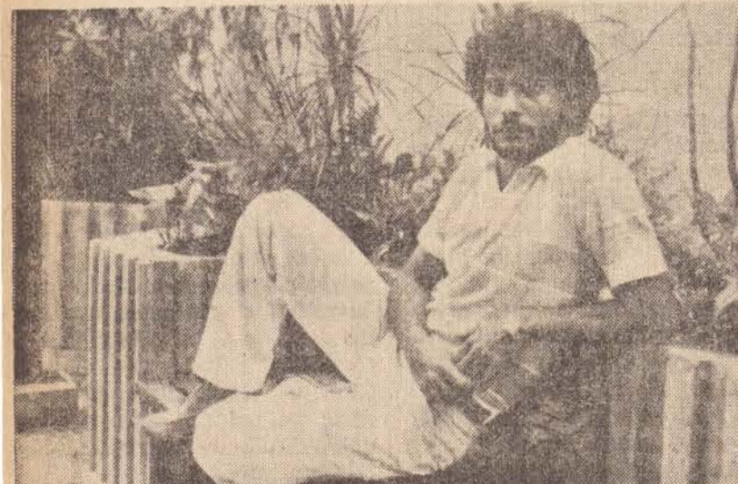
“ELAS POR ELAS” MAIS UMA NOVELA

PEIXES — 20/2 a 20/3 — Grandes idéias para serem colocadas em prática. Evite excessos alimentares pois seu organismo não suportará. Relações fáceis e espontâneas com pessoas do sexo oposto.