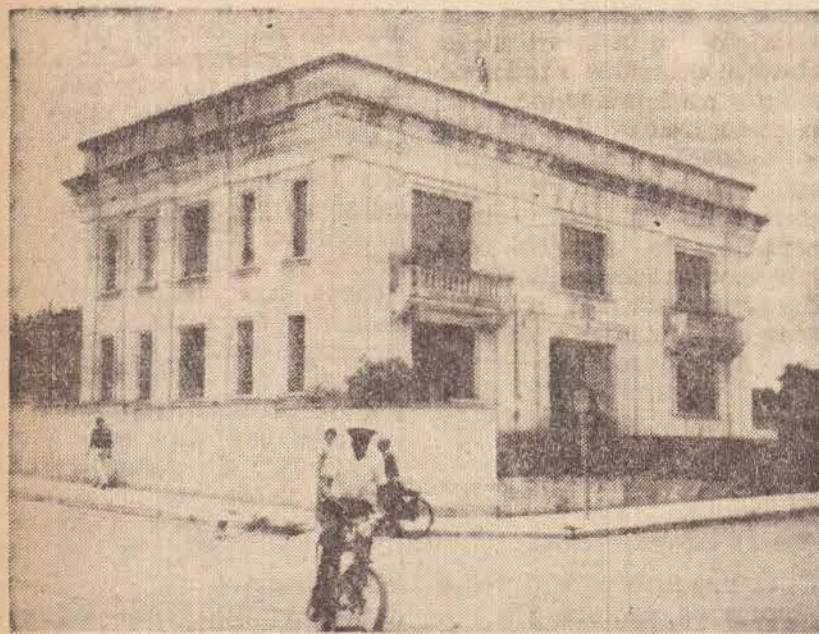
MAURO L.T. GARRIDO Correspondente

A reunião dos três poderes Executivo, Judiciário e Legislativo — numa só praça é a grande aspiração do município de Regente Feijó na atualidade. Ocorre que a Prefeitura já está funcionando em amplas instalações na Rua José Gomes, onde os prédios existentes estão incluídos numa área de mais de 24.200 metros quadrados. Por isso, existe uma área de terras muito grande disponível para a construção de um novo prédio do Fórum, para funcionamento do poder Judiciário,