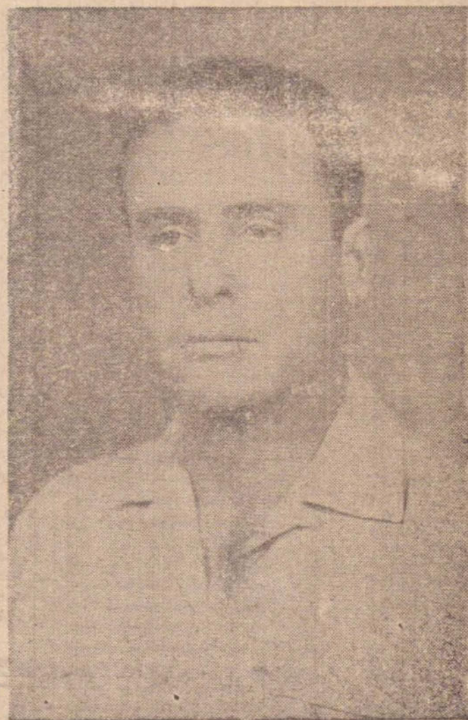
CAIU A MÁSCARA DO DITADOR

Os fatos foram presenciados por populares que passavam por ali na ocasião e por quase todos os vizinhos, tal a fúria do parafraseado (Conclui na última página)