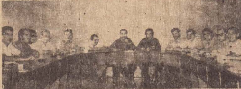
Uma parte dos participantes da reunião ordinária de domingo último.