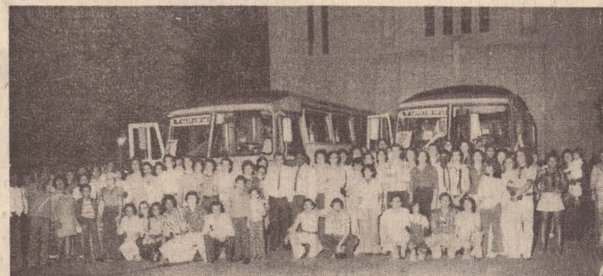
Uma foto defronte à Igreja da Penha.

bi. Em continuação, passearam por toda extensão da ponte Rio-Niterói e uma pequena vista aos Submarinos Brasileiros e passagem pela Praia de Icarai, (Niterói). Na parte da noite rumaram para as boates da Barra da Tijuca. No domingo saíram às 6 horas para a Praia de Copacabana, retornando às 11 horas para o alojamento. Depois do almoço visitaram o Aeroporto Santos Dumont, Monumento dos Pracinhos e Aeroporto Internacional do Galeão, passando em seguida pela Igreja da Penha. Assistiram ao jogo Flamengo, e Botafogo no Maracanã e partiram em seguida para São Paulo, com jantar no restaurante "O Gaucho". Por volta das 7 horas de segunda-feira, os excursionistas chegaram em Presidente Prudente. Todos estavam satisfeitos, pois, realmente foi uma das melhores excursões programada pelo Sindicato dos Empregados no Comércio de Presidente Prudente.