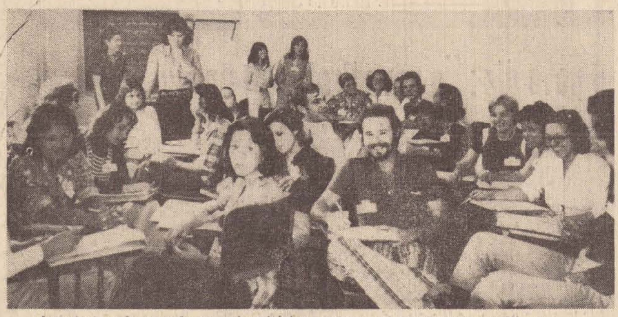
Aspecto tomado, quando os universitários recebiam orientações sobre o Plimec.

O prefeito e comitiva tentarão nessa viagem resolver definitivamente o impasse, embora não estivesse em sua agenda, ir até a Federação do Comércio.