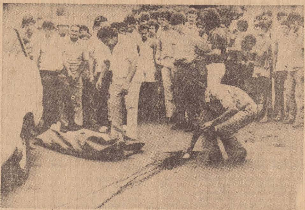
Pela inadvertência de um motorista irresponsável operário perde a vida tragicamente.